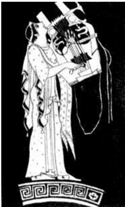
Аполлон с кифарой.