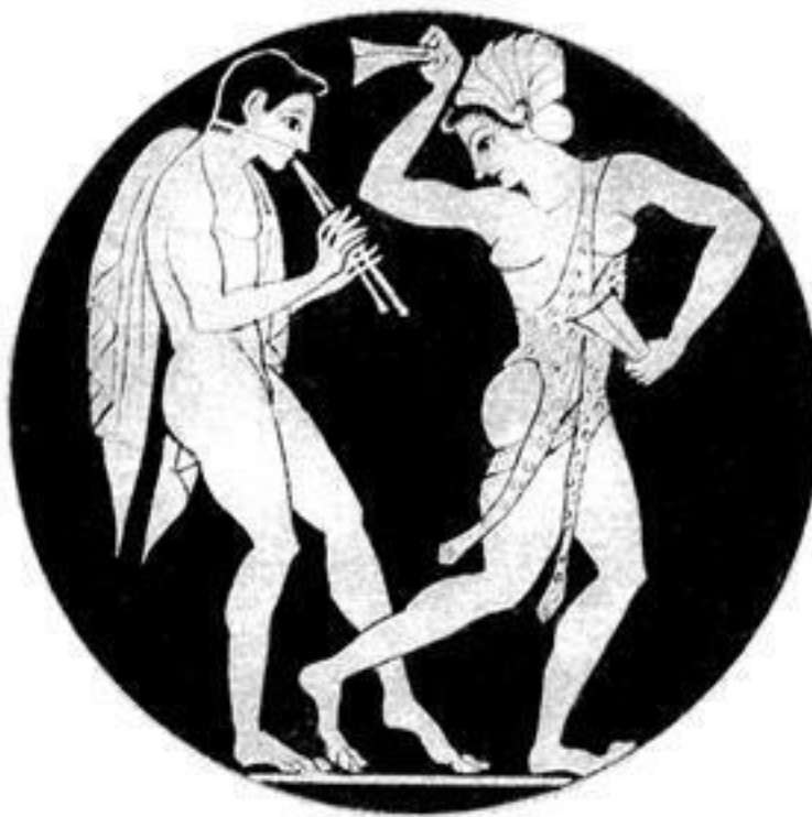
Музыкант, играющий на двойной флейте.

Наиболее ранним историческим этапом развития европейской музыкальной культуры принято считать античную музыку, традиции которой берут свое начало в более древних культурах Ближнего Востока, но не повторяют их путь. Однако в настоящее время сделать какие-либо выводы о музыкальной культуре античности затруднительно. Дело в том, что в распоряжении музыковедов имеются лишь единичные образцы древнегреческой и древнеримской музыки. Найдено всего 11 образцов музыки (в основном гимны и оды), относящихся к античной эпохе, и по ним, увы, невозможно отразить направление музыкального процесса того времени.