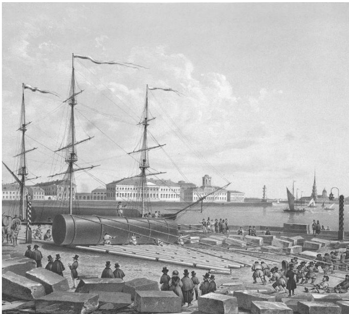
Перед нами город, возникший в эпоху зарождающегося империализма.