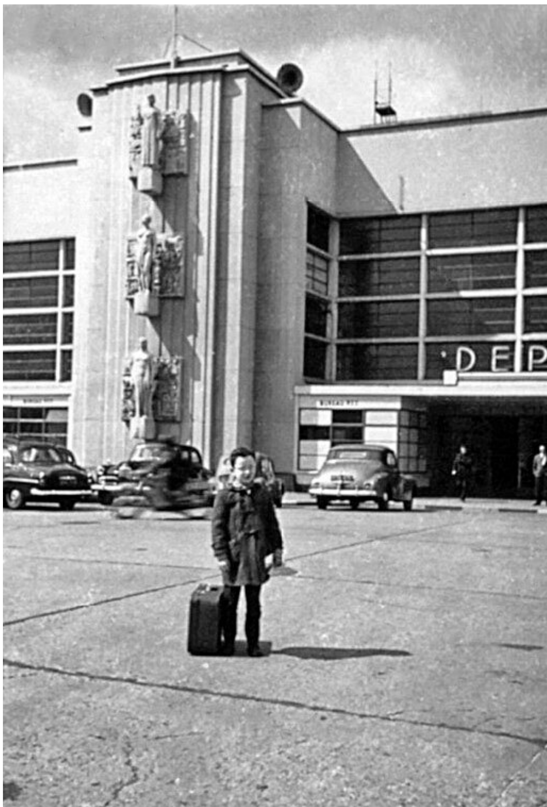
Отправление в Кёльн