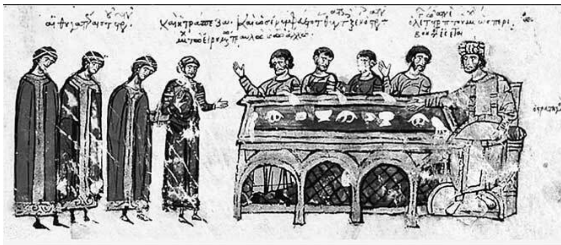
Илл. 1.1. Военачальник предлагает своих дочерей в жены гостям во время пира, миниатюра Мадридского Скилицы

«Кто в гневе поднял топор на свою супругу, – убийца» ( Василий Великий . Письма 188, 8).