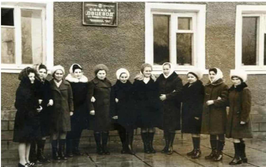
Бухгалтерия совхоза «Овцевод»

Шестнадцатого августа директор так тепло меня принял, что у меня развеялись все сомнения. Пообещал решить и жилищный вопрос. В станице совхоз строит улицу переселенческих домиков – Молодёжную, вот там и нам выделяют домик. Слава Богу, всё складывается прекрасно.