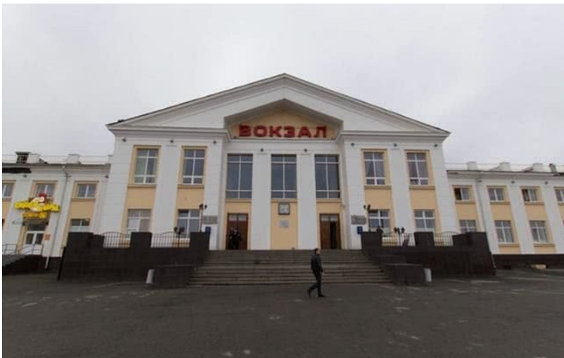
Вокзал Нижнего Тагила

Стоя на ступеньках вокзала, можно было увидеть просторную привокзальную площадь и широкую улицу, уходящую в глубь города. Я обнял за плечи Лену и Серёжу: