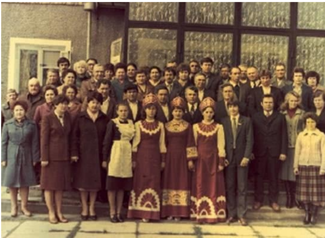
К встрече Горбачёва

Шестнадцатого августа директор так тепло меня принял, что у меня развеялись все сомнения. Пообещал решить и жилищный вопрос. В станице совхоз строит улицу переселенческих домиков – Молодёжную, вот там и нам выделяют домик. Слава Богу, всё складывается прекрасно.