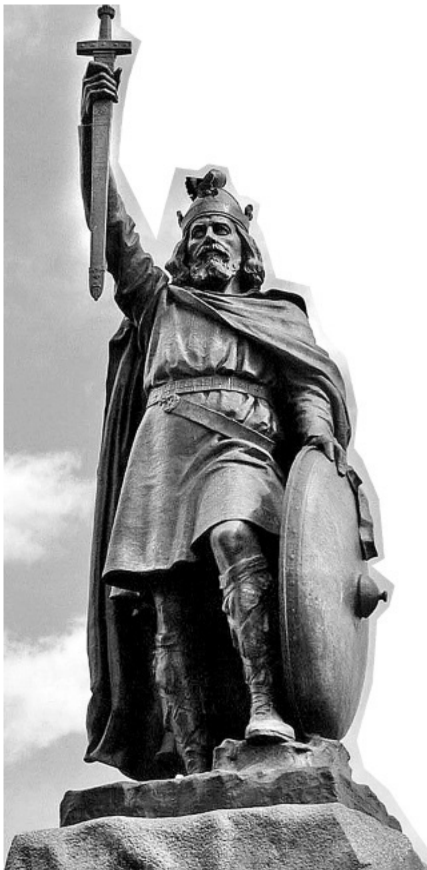
Хамо Торникрофт. Статуя Альфреда Великого, управлявшего королевством Уэссекс в 871–899 годах. Уинчестер