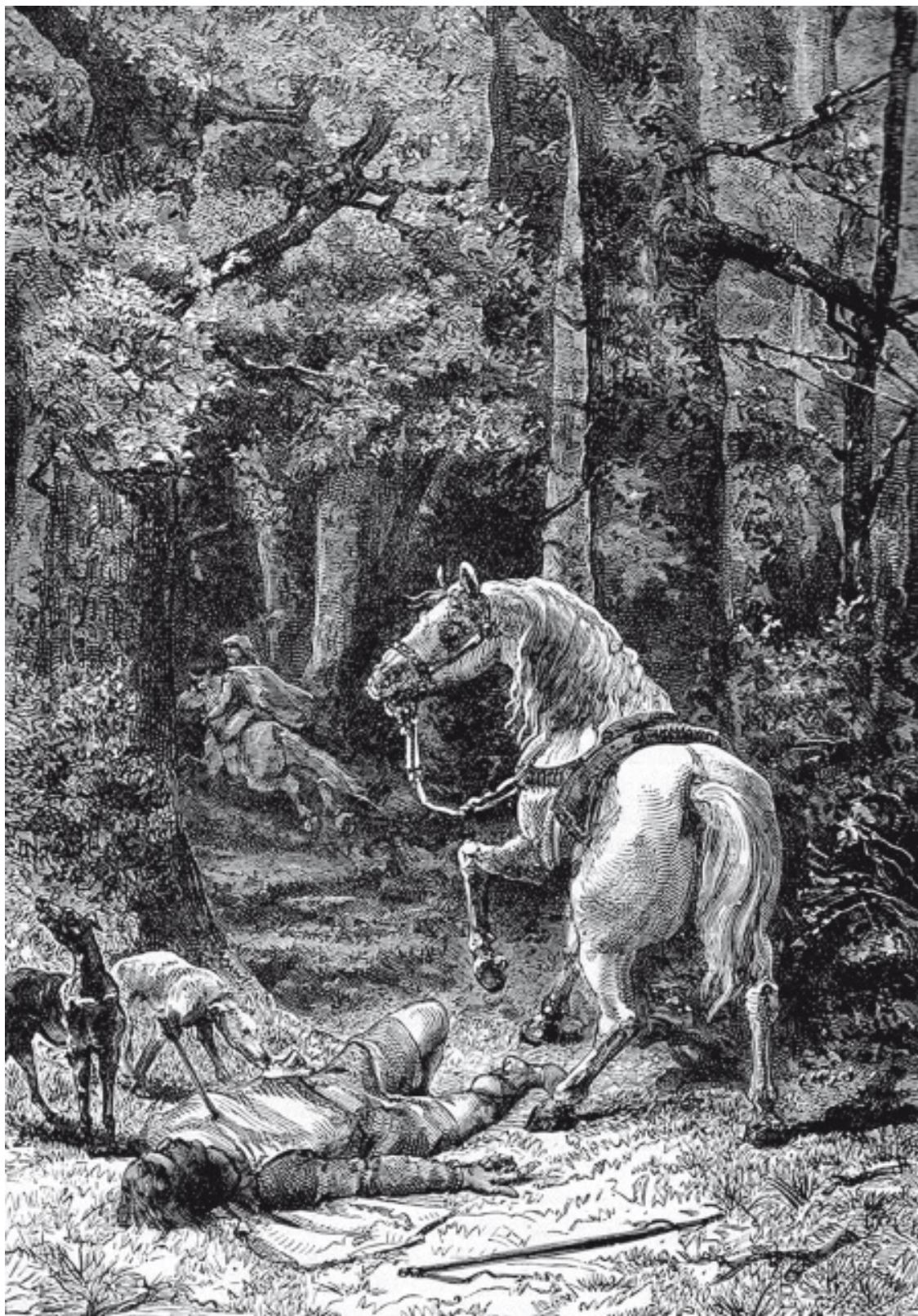
Альфонс де Невилл. Смерть Вильгельма II Руфуса. Литография. 1895

Обстоятельства его гибели – это одна из главных загадок правления Вильгельма II. Описывали их по-разному. Одни утверждали, что Вильгельм 2 августа 1100 года отправился с группой англонормандских аристократов на охоту в Нью-Форест (Гемпшир). Во время преследования добычи группа придворных разделилась, в результате чего король остался вместе с Вальтером Тиррелом, одним из своих ближайших приближенных. Вечером они наткнулись на