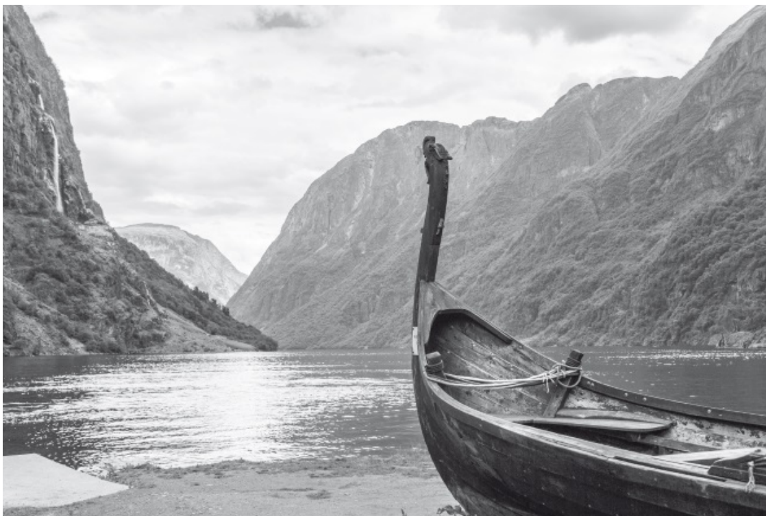
Драккар викингов между Фломом и Гудвангеном, Согнефьор, Норвегия

Другие историки утверждают, что первым, кто отличился в истории Англии, был Этельберт, король Кента, правивший с 591 года до самой своей смерти в 616 году. Этот язычник укрепил союз с франками, жившими на другом берегу Ла-Манша, женившись на Берте, дочери Хариберта I из рода Меровингов и внучке знаменитого короля Хлотаря I. Этельберт принял крещение и в 602 году подарил бенедиктинцам участок земли в Кентерберии для строительства собора. Монах Августин, присланный папой Григорием миссионер, стал архиепископом Кентерберийским – первым архиепископом в истории Англии, а Этельберт «принял первый свод из девяноста законов, в котором даровал привилегии христианской церкви. Кстати, это был первый документ, написанный на англосаксонском языке». 7