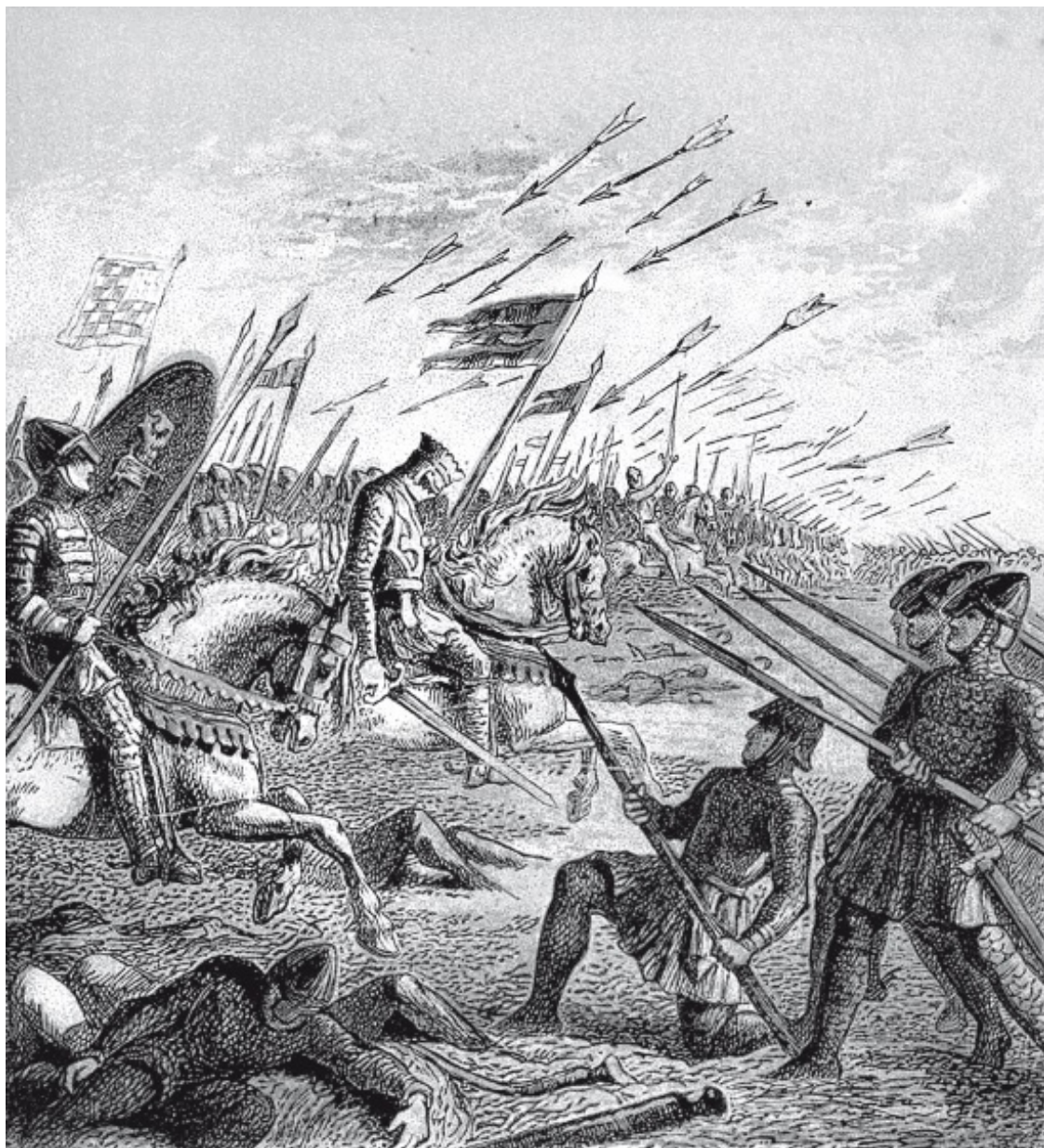
Джозеф Мартин Кронхейм. Битва при Гастингсе. Гравюра. 1868

Под Вильгельмом была убита лошадь. Видевшие падение герцога успели подумать, что он убит. Но герцог поднялся и быстро нашел себе другую лошадь. В конечном итоге армия короля Гарольда была полностью разгромлена: на поле боя остались лежать несколько тысяч отборных английских воинов. Был убит и сам король (считается, что его поразила случайная стрела, попавшая в глаз), а также два его брата.