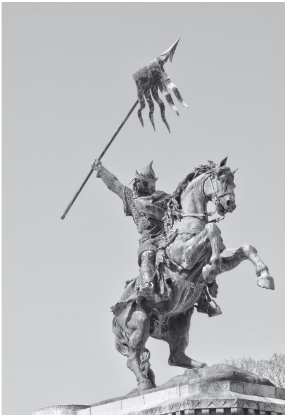
Луи Роше. Памятник Вильгельму Завоевателю. 1851. Фалез

Вильгельм Завоеватель скончался 9 сентября 1087 года в возрасте 60–62 лет в монастыре Сен-Жерве, что около Руана. Перед смертью он завещал английский престол своему второму сыну Вильгельму Руфусу (Рыжему), отстранив таким образом Роберта Куртгёза от наследования.