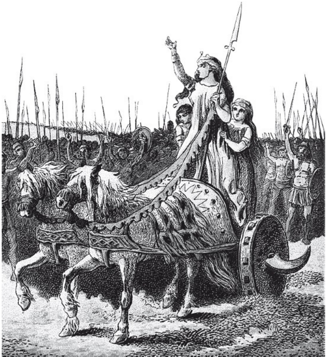
Джозеф Мартин Кронхейм. Будикка, лидер восстания против римлян. Гравюра. 1868

Историк Тацит в «Анналах» говорит о том, что кельтские женщины и друиды потрясли римских солдат.