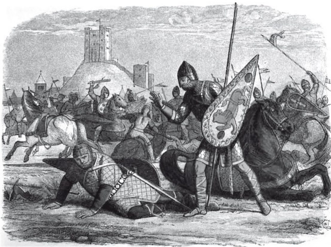
Эдмунд Эванс по картине Джеймса Дойла. Роберт Куртгёз ранит своего отца. Гравюра. 1864

поддержал в 1078 году мятеж старшего сына Вильгельма, Роберта Куртгёза, недовольного отсутствием у него реальной власти. Роберт попытался захватить Руан, но был отбит и бежал во Фландрию. Вскоре он с французской помощью обосновался в замке Жерберуа на нормандской границе и стал разорять владения своего отца. Вильгельм лично возглавил армию, осадившую Жерберуа, и принудил город к капитуляции. Роберт в одном из боев даже свалил своего отца с коня и ранил его, а потом ему удалось бежать, и он нашел убежище у короля Франции.