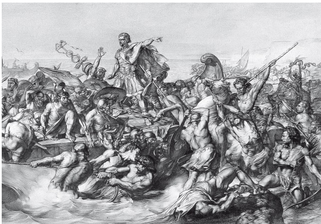
С рисунка сэра Эдварда Армитиджа. Первое вторжение Цезаря в Британию. Ок. 1843

Цезарь считал бриттов одной из отсталых ветвей кельтских племен, подобных тем, которые он приводил к подчинению в Галлии. С армией из десяти легионов (менее 50 000 солдат) он собирался бороться против воинственного народа, насчитывавшего около полумиллиона воинов. При этом Цезарь не считал завоевание Британии важнейшей задачей, стоящей на повестке дня. В упомянутом походе 56 года до н. э. он разбил бриттов и оттеснил их к Темзе. Там бриттов возглавил Кассибелан. Он сражался очень решительно, при отступлении применял тактику выжженной земли и пытался подговорить южные племена сжечь корабли римлян. Однако ни воинское искусство, ни решимость не помогли бриттам, которые в довершение ко всему еще и начали ссориться между собой, завидуя власти Кассибелана и подозревая его в измене. А победоносный Цезарь, заключив выгодный мир, вернулся в Рим. То же самое повторилось и через год, когда Цезарь, снова разбив бриттов, получил приличную контрибуцию.