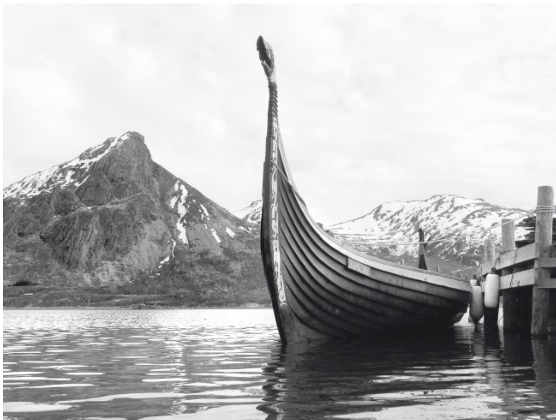
Корабль викингов (драккар) в Норвегии

В 790 году три таких драккара причалили к берегу в королевстве Уэссекс. Из Дорчестера прискакал посланник, чтобы приветствовать гостей и спросить, зачем они пожаловали. Он был убит на месте.