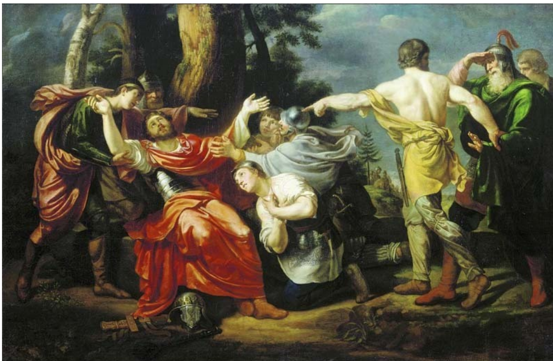
«Дмитрий Донской на Куликовом поле». О. А. Кипренский. 1805 г.

Теперь в Орду поехал (с богатыми подарками) московский князь. Новый хан, Мамай, выдал ярлык ему. Через 3 года Дмитрий Иванович со своим войском подошёл к Твери. Он пять недель осаждал город. Михаил не соглашался заключить мир, по условиям которого он был бы должен подчиняться во всём московскому князю.