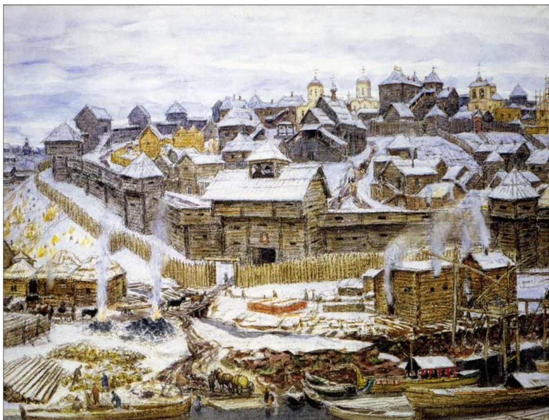
«Кремль при Иване Калите». А. М. Васнецов. XIX в.

Между тем в Твери происходили следующие драматические события. Однажды в этот город, когда там находился Александр Михайлович, приехал мурза (родственник хана), Шевкал. Кто-то пустил слух, что монголы, убив тверских князей Михаила и Дмитрия, теперь-де намерены убить и Александра. Александр испугался и велел сжечь дом, где остановился мурза. Тот сгорел заживо вместе со своей охраной. Тверичи сгоряча перебили всех находящихся в городе монголов – купцов, баскаков и др.