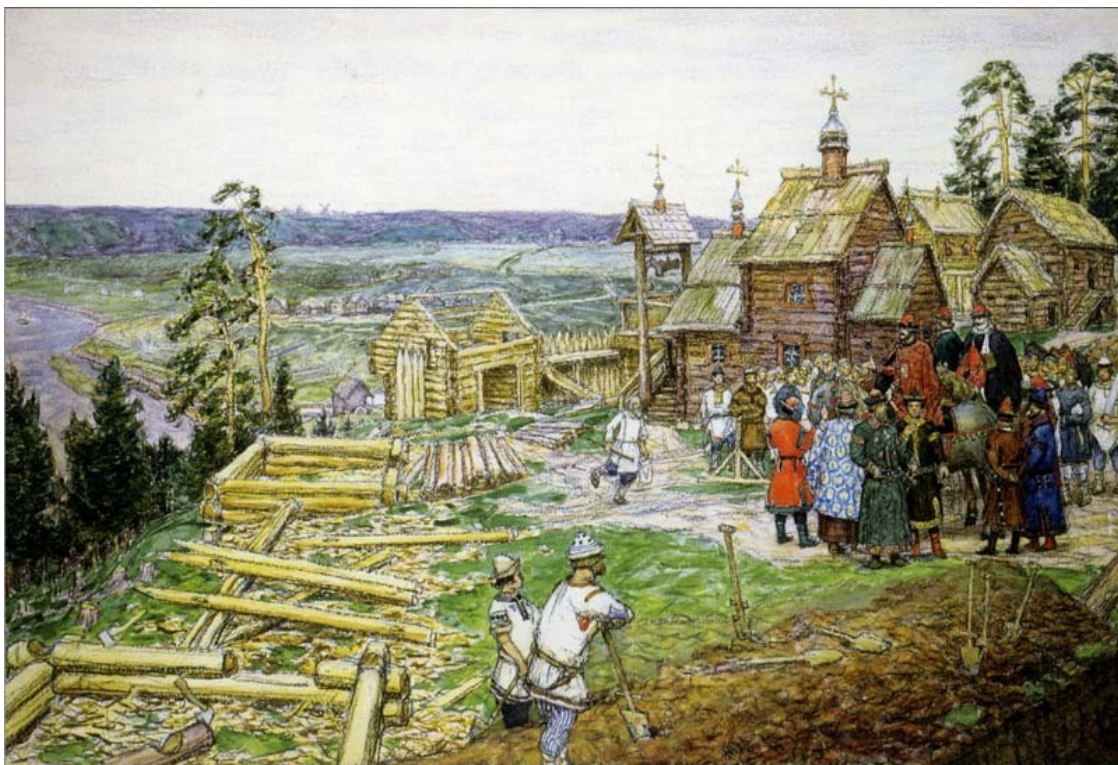
«Основание Москвы. Постройка первых стен Кремля Юрием Долгоруким в 1156 году». А. М. Васнецов. 1917 г.

А князь Юрий Долгорукий всё-таки воссел на великокняжеский престол в Киеве, это произошло 20 марта 1155 г. Через два года, 15 мая 1157 г., он неожиданно умер, как полагают, от отравления (во время трапезы). Жители Киева, узнав о кончине князя, ворвались в княжеский дом, разграбили его, перебили всех находящихся там людей. Пострадали суздальские купцы, торговавшие в Киеве. По различным городам прокатилась волна грабежей и убийств. Карамзин пишет, что князь, похоже, не пользовался любовью населения.