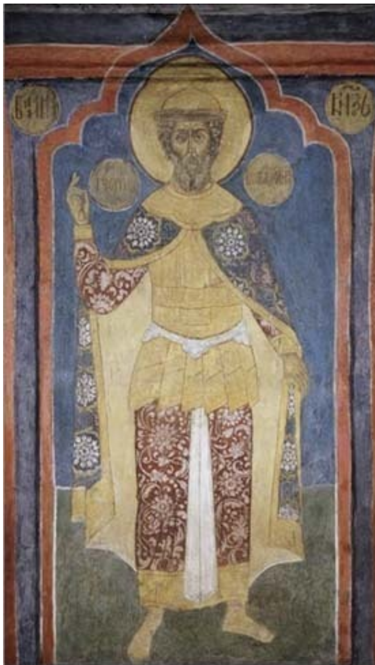
Юрий Всеволодович. Фреска в Архангель- ском соборе Кремля

Через 13 лет огромное (300 тысяч всадников) монгольское войско опять вторглось на русские земли. Этой ордой руководил внук Чингисхана, Батый; помощником у него был участник битвы на Калке, Субедей. Первой подверглась удару Рязань. Рязанским князьям взялись помогать князья Коломенский, Пронский и Муромский. Великий князь Владимирский и здесь отказал в помощи.