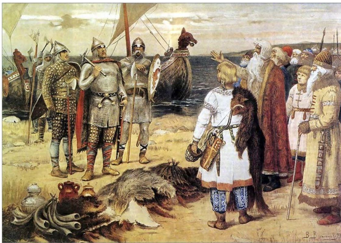
«Прибытие Рюрика в Ладогу». Васнецов В. М. XIX в.

Рюрик умер в 879 г., не оставив потомства. Но есть версия, что у него был малолетний сын, Игорь . На протяжении следующих семи веков правители России выводили свою родословную по прямой мужской линии от Игоря и – считая Игоря сыном Рюрика – называли себя Рюриковичами.