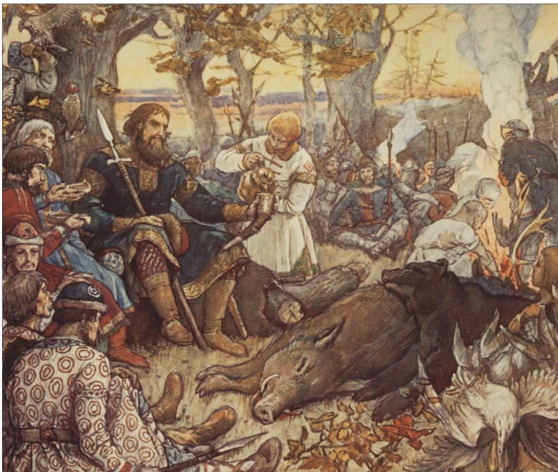
«Отдых великого князя Владимира Мономаха после охоты». В. М. Васнецов. 1895 г.

Владимир и Святополк II действовали совместно против половцев, Олег отказался им помогать. Не явился Олег и на созванный великим князем съезд удельных князей. Тогда войско великого князя изгнало Олега из Чернигова, тот ушёл в Муром, убив правившего там сына Владимира Мономаха, Изяслава. В 1097 г. все князья всё же собрались вместе, наметив общий план борьбы против половцев. Но в тот же год кровавые междоусобицы возобновились.