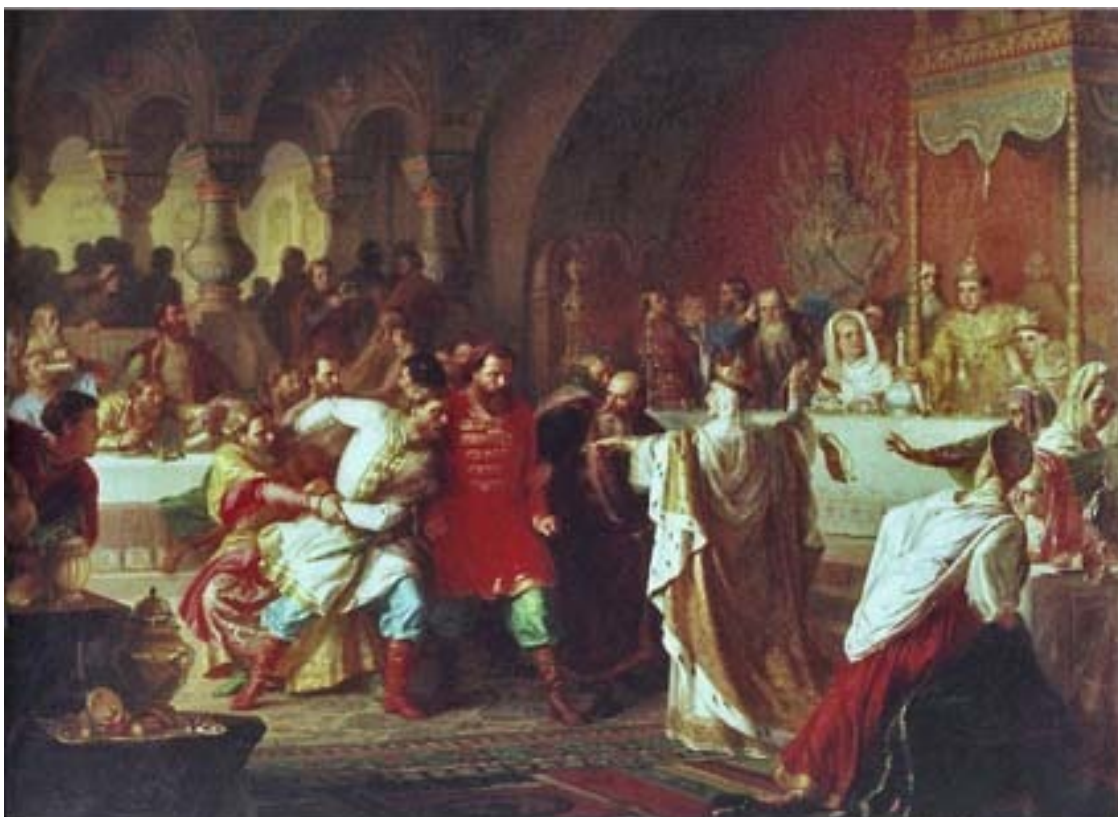
«Великая княгиня София Витовтовна на свадьбе великого князя Василия Тёмного». Карл Гун. 1861 г.

От Софьи Иван III узнал, что по византийским обычаям правитель недосягаем для подданных. За покушение на жизнь правителя или даже за бранное слово в его адрес должно следовать наказание – вплоть до смертной казни. Византийские порядки (пышность, показное величие и, к сожалению, интриги) стали постепенно входить в быт Московского княжества. Иван III вскоре стал считать себя преемником Византийской Империи, на государственной печати появился двуглавый орёл – как в Византии. Старший сын Софьи Палеолог, будущий великий князь Василий III , наслушавшись с детских лет рассказов матери об истории Византии (в древности называвшейся Восточной Римской Империей), произнёс знаменитую фразу: «Москва – третий Рим, а четвёртому Риму не бывать».