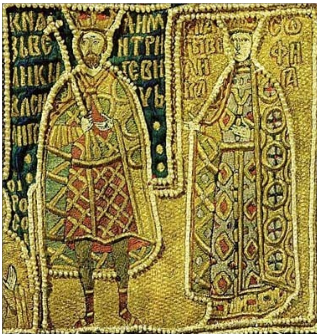
Василий Дмитриевич и Софья Витовтовна (шитье на саккосе митрополита Фотия). 1414–1417 гг.

Юрий Дмитриевич проявил великодушие, отложив поездку в Орду на несколько лет, пока Василий II не сможет самостоятельно (конечно, в сопровождении слуг) отправиться в далёкое и небезопасное путешествие в Орду. Наконец, когда племяннику исполнилось 16 лет, оба князя поехали в Орду. Софья Витовтовна собрала для хана Мухаммеда и отправила с сыном подарки более дорогие, чем привёз с собой князь Юрий. В результате ярлык на великое княжение получил юный Василий II. Галицкий князь вынужденно смирился.