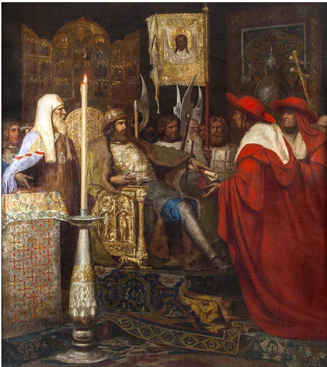
«Князь Александр Невский принимает папских легатов». Г. И. Семирадский. 1876 г.

Быть великим князем в стране, завоёванной иностранцами, нелегко. Однажды монголы решили взимать дань с населения Новгорода, который, как мы помним, не был ими завоёван. В Новгород прибыли баскаки (сборщики дани) и пошли по домам, так как дань была объявлена подушной: каждый человек, проживавший в доме (независимо от возраста и размера имущества) должен был платить одинаковых размеров дань. Дань не платили лишь те, кто проживал за воротами храма – в церкви или в монастыре. Новгородцы возмутились, некоторых баскаков поубивали, а остальные помчались в столичный город Владимир к великому князю Александру Ярославовичу.