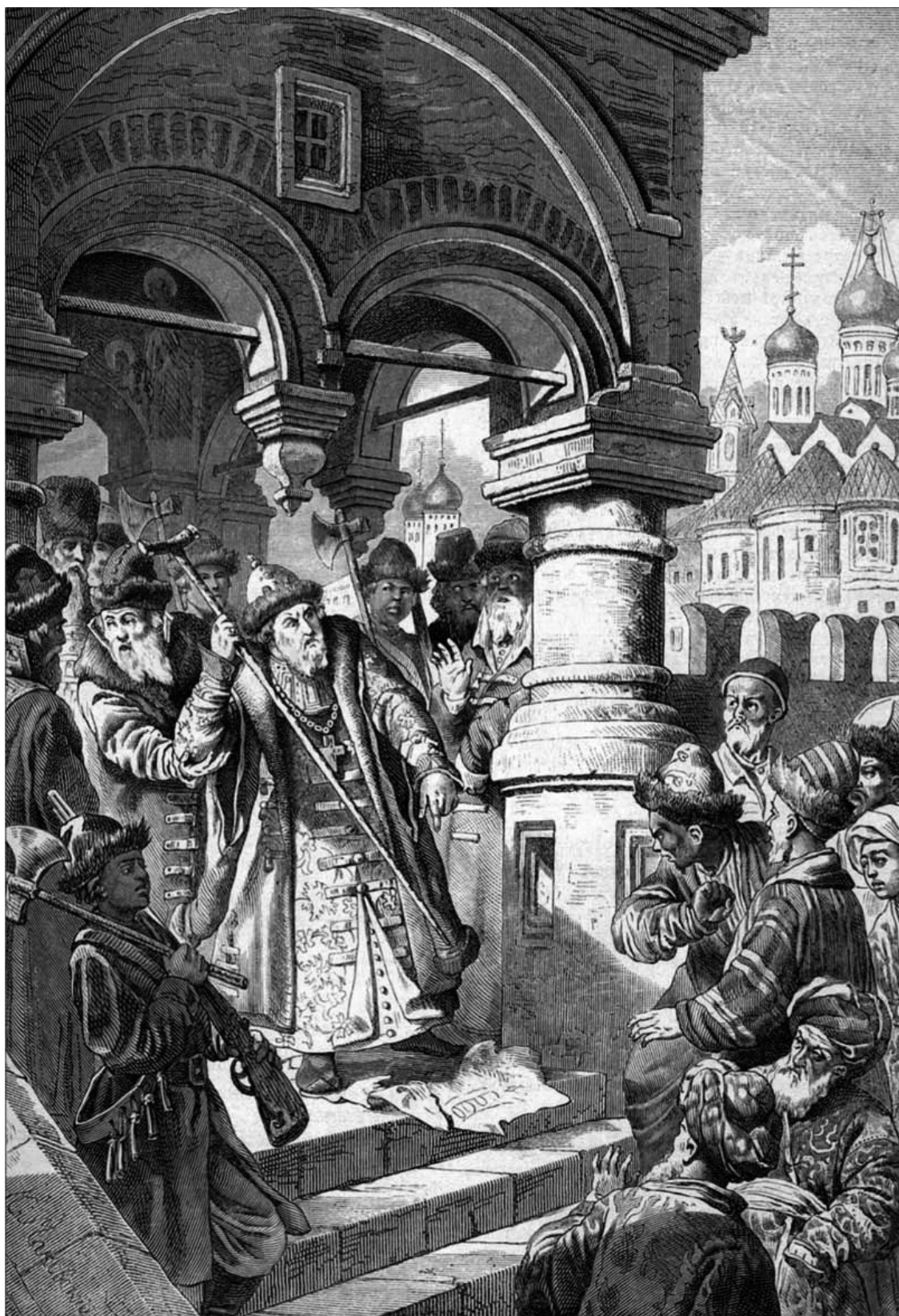
«Иоанн III и татарские послы». К. Е. Маковский. 1870 г.