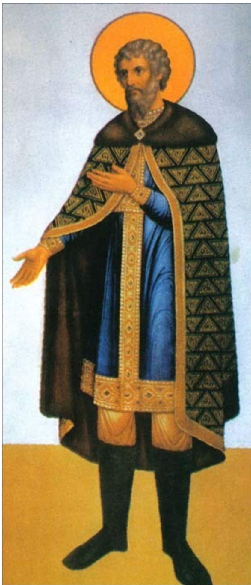
Ярослав I Мудрый.