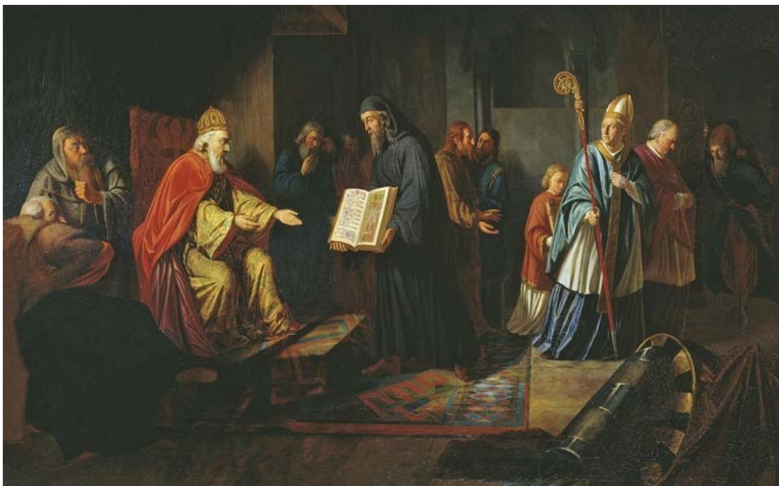
«Великий князь Владимир избирает религию». И. Эггинк. 1822 г.

В летописи отмечается, что деревянную статую Перуна (ещё недавно установленную Владимиром) сняли с пьедестала, привязали к хвосту лошади и избili плетью. Потом униженного и избитого идола отвязали от хвоста лошади и сбросили с высокого правого берега Днепра в воды реки. Были выделены специальные дружинники, которые сопровождали статую вплоть до порогов (около 550 км), отталкивая её палками от берега, дабы местное население – язычники не могло вытащить идола назад, на берег.