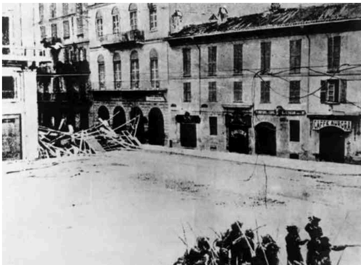
Бои на улицах Милана в мае 1898 г.