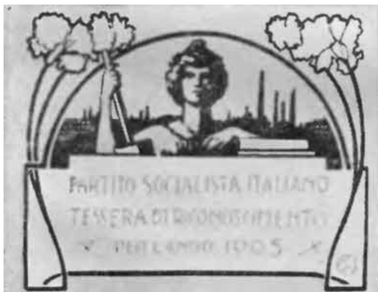
Билет Социалистической партии