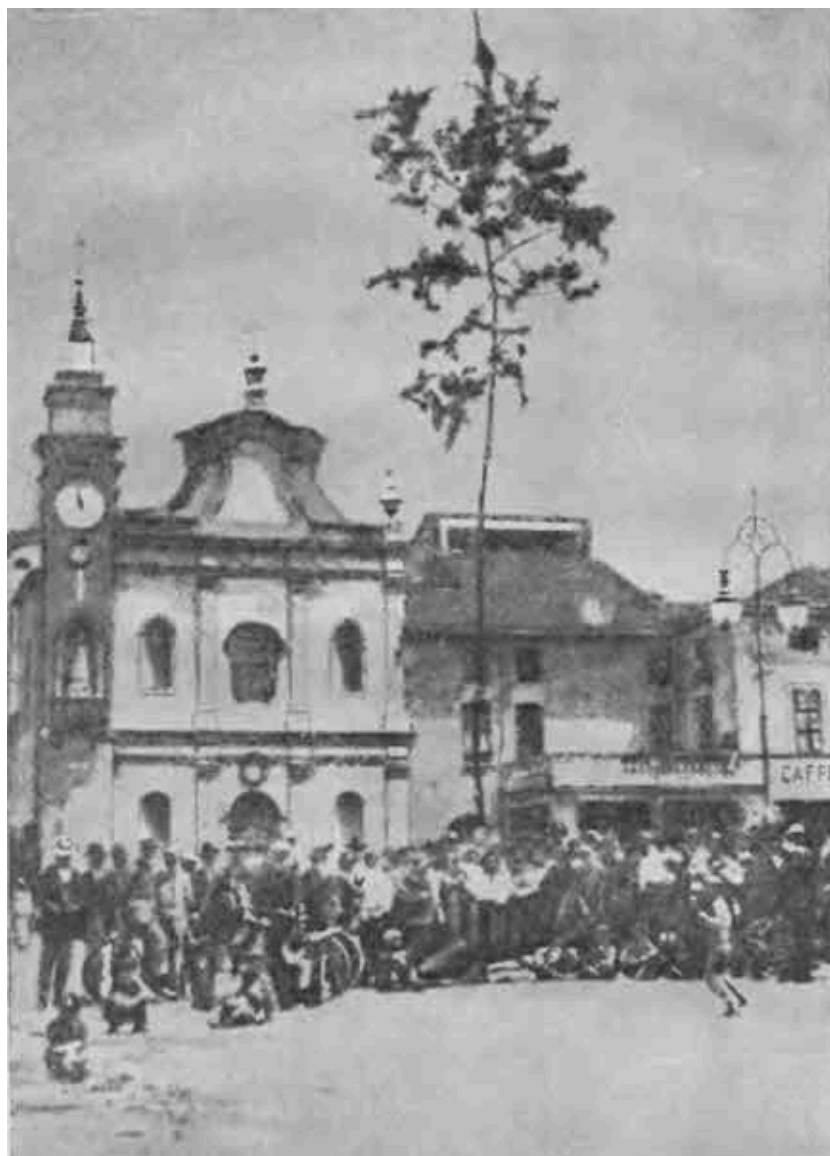
«Дерево мира», посаженное участниками антивоенного митинга в одном из провинциальных городов Италии. 1915 г.