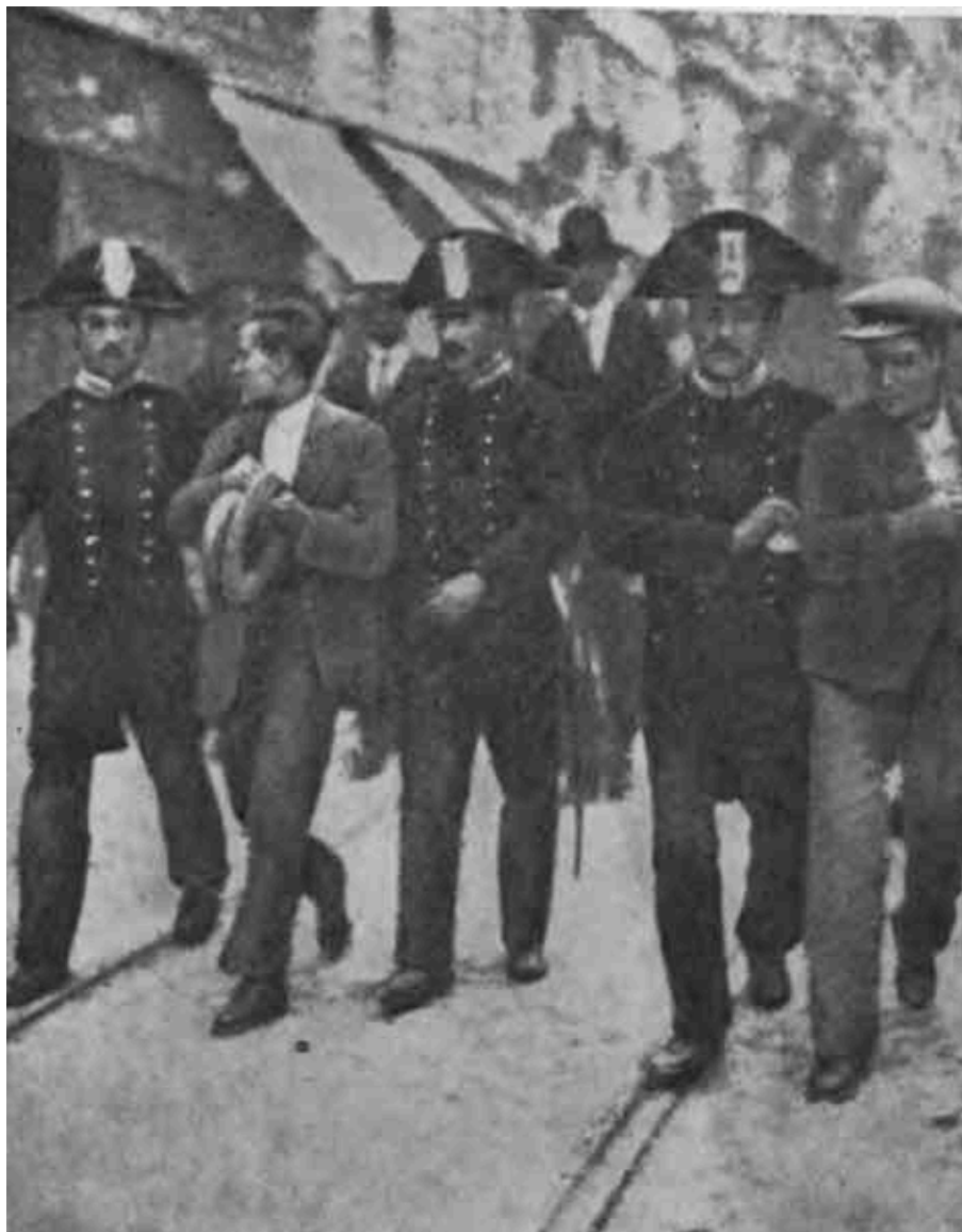
Разгон антивоенной демонстрации. 1914 г.