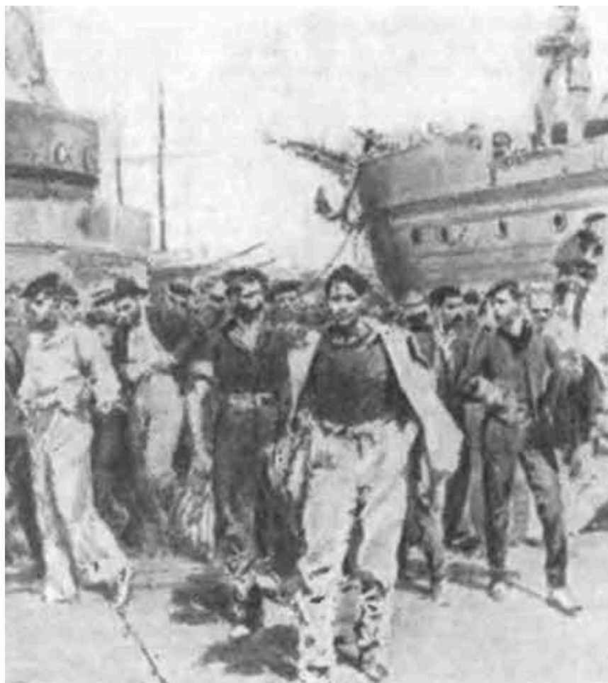
Стачка портовых рабочих в Генуе в знак протеста против роспуска Палаты труда. 1900 г.