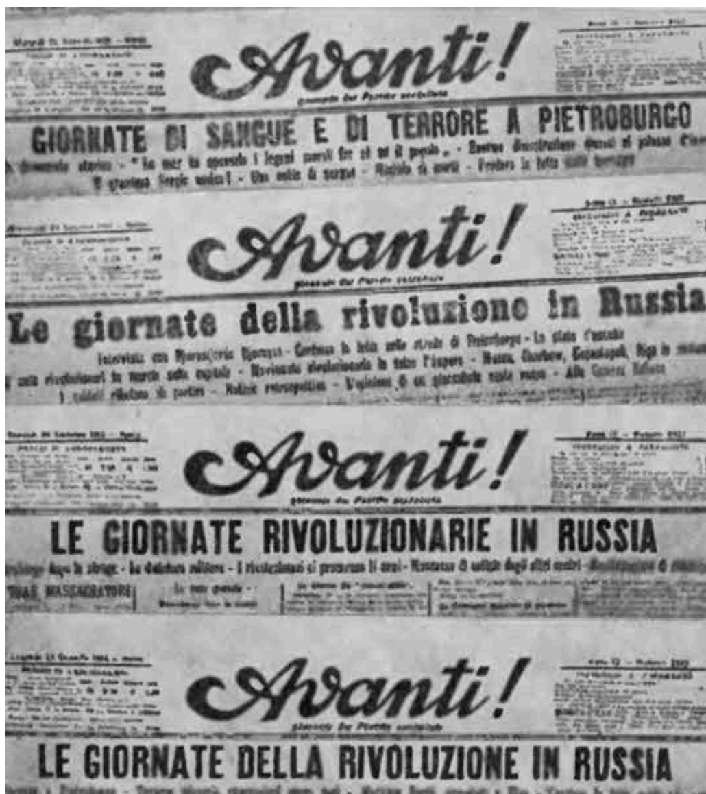
Заголовки статей «Аванти!» о первой русской революции. 1905 г.