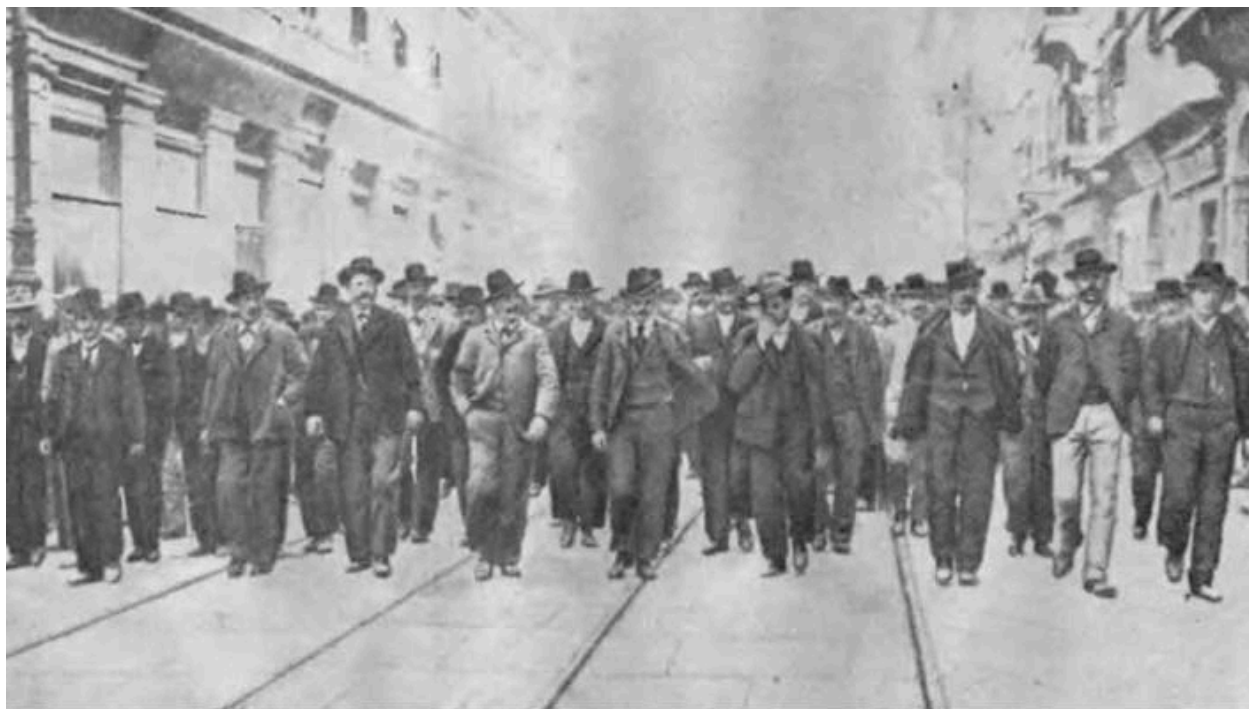
Демонстрация 1 мая 1902 г. в Триесте