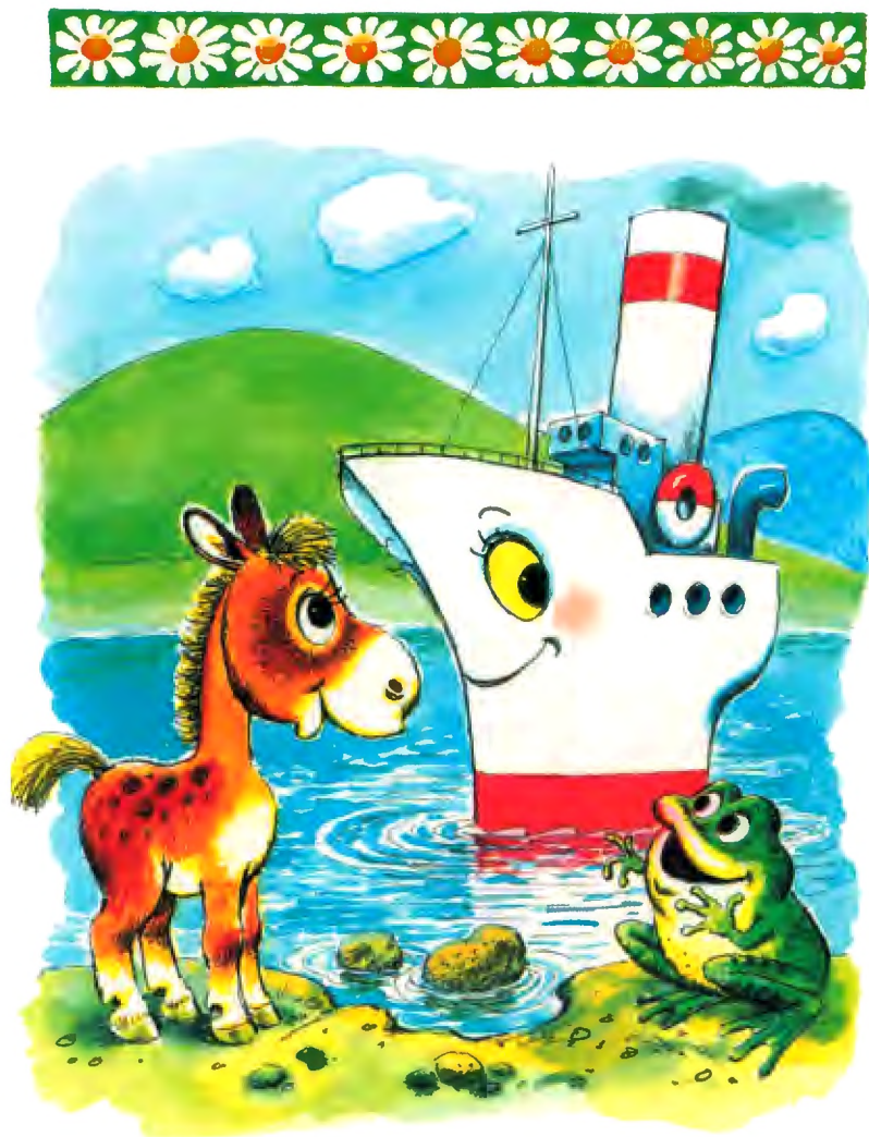
«Пароходик» Рис. А. Савченко