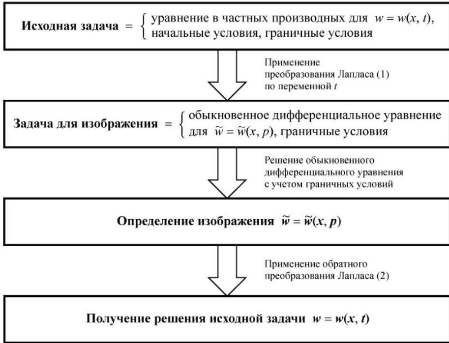
Рис. 2. Схема решения линейных краевых задач с помощью преобразования Лапласа.

Пример 1. Рассмотрим задачу для уравнения теплопроводности