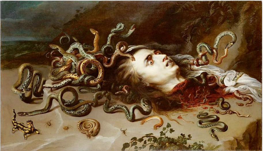
Haupt der Medusa von Peter Paul Rubens, circa 1617/18.

Ich beantrage die Verhaftung und strafrechtliche Verurteilung aller Teilnehmer und Organisatoren des 22. EPA-Kongress 1 wegen eines gemeinschaftlichen und bandenmäßigen Betrugs zwecks eigennütziger Bereicherung; wegen Durchführung pseudomedizinischer Experimente an Menschen, um chemische Kampfstoffe auszutesten; wegen Rechtfertigung der Hexenverfolgung. Im Einzelnen handelt es sich um die Straftatbestände Betrug, Fälschung akademischer Graden, Kurpfuscherei, Mord, gefährliche Körperverletzung, Nötigung, Freiheitsberaubung, Entführung, Bildung krimineller und terroristischer Vereinigung. Die Begründung genannter Maßnahmen erfolgte früher {2-4}, und wird im Folgenden erweitert und ergänzt.