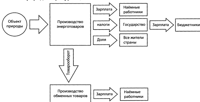
Схема распределения прибавочного продукта, предложенная партией «Патриоты России» (на счета граждан перечисляется доля от продажи природных ресурсов)

Отличительной чертой этой схемы является получение прибавочного продукта жителями страны непосредственно от производителя энерготоваров, а не от государства.