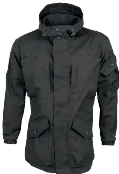
1301543 / черный