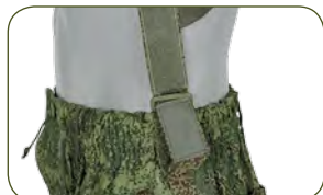
в комплекте идут съемные боковые подтяжки, возможна небольшая регулировка по высоте