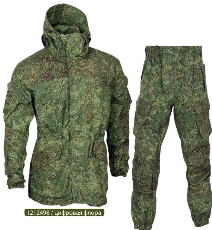
1212498 / цифровая флора