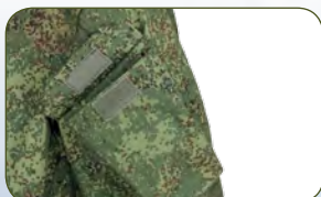
наклонные карманы на рукавах, закрыты клапанами на липучке