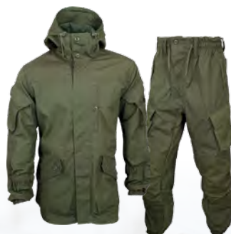
1212493 / tobacco / 1212593