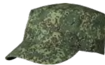
1400799 / цифровая флора