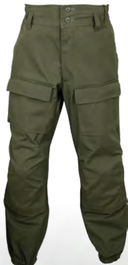
1205493 / tobacco