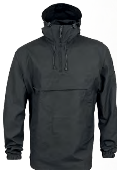
1308243 / черный