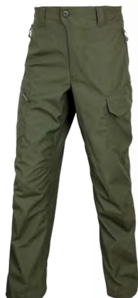
1215593 / tobacco