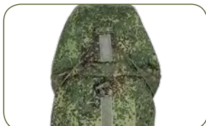
капюшон с регулировкой в трех измерениях: по овалу лица, по вертикали на затылке и регулировка бокового зрения