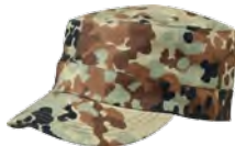
1400773 / tibet