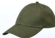
1408257 / tobacco