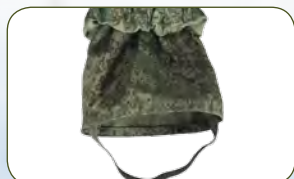
пылезащитные муфты с регулировкой объема резинкой, оснащены эластичной штрипкой