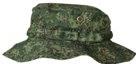
1408099 / цифровая флора