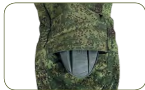
колени защищены пенополиуретановой съемной вставкой (идет в комплекте)