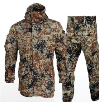
1212473 / tibet / 1212573