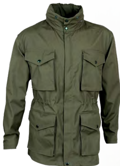
1301493 / tobacco