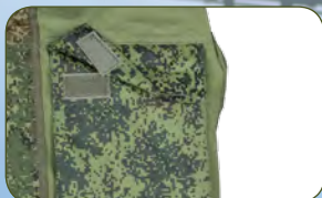
внутренний влагозащитный карман для документов на липучке