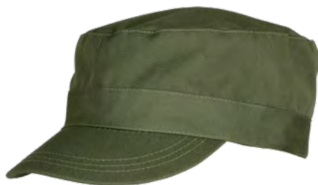
1400791 / tobacco