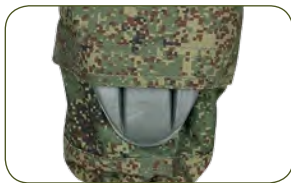
локти защищены пенополиуретановой съемной вставкой (идет в комплекте)