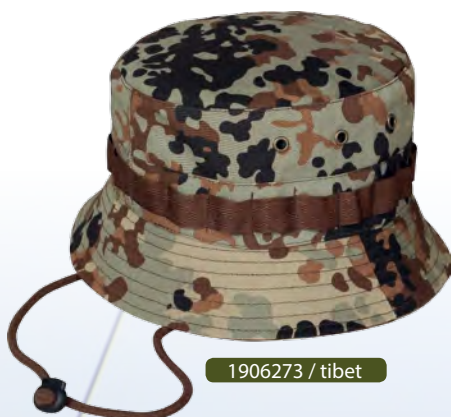
1906273 / tibet