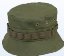
1906291 / tobacco