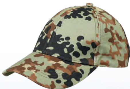
1408273 / tibet