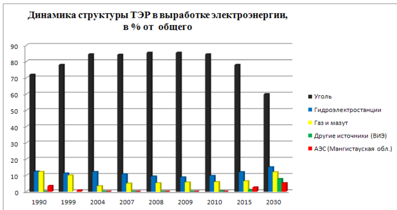
Рисунок. Динамика структуры топливно-энергетических ресурсов Казахстана в производстве электроэнергии за 1990-2030 годы (по данным Агентства РК по статистике, АО KEGOC и планам Правительства РК)

Самым эффективным решением сокращения природных ресурсов, является практика энергосбережения и внедрения энергоэффективных технологий. Повышение энергоэффективности является весьма актуальной задачей для экономики Казахстана. Удельные показатели энергоемкости ВВП в Казахстане по данным МЭА остаются весьма высокими (1,8 USD/кг.у.т) по сравнению с развитыми странами (5,5 USD/кг.у.т). За период реформирования экономики с 1991 по 2001 г.г. энергоемкость ВВП еще повысилась на 15 - 20%, что негативно сказалось как на экономике в целом, так и на конечных потребителях. За период 2001-2012 энергоемкость ВВП немного снизилась, но все ещё превышает среднемировой тренд в 5 раз.