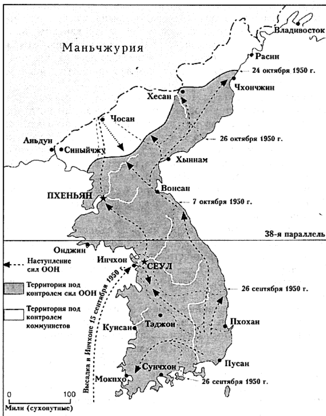
Наступление сил ООН и ситуация осенью 1950 года.