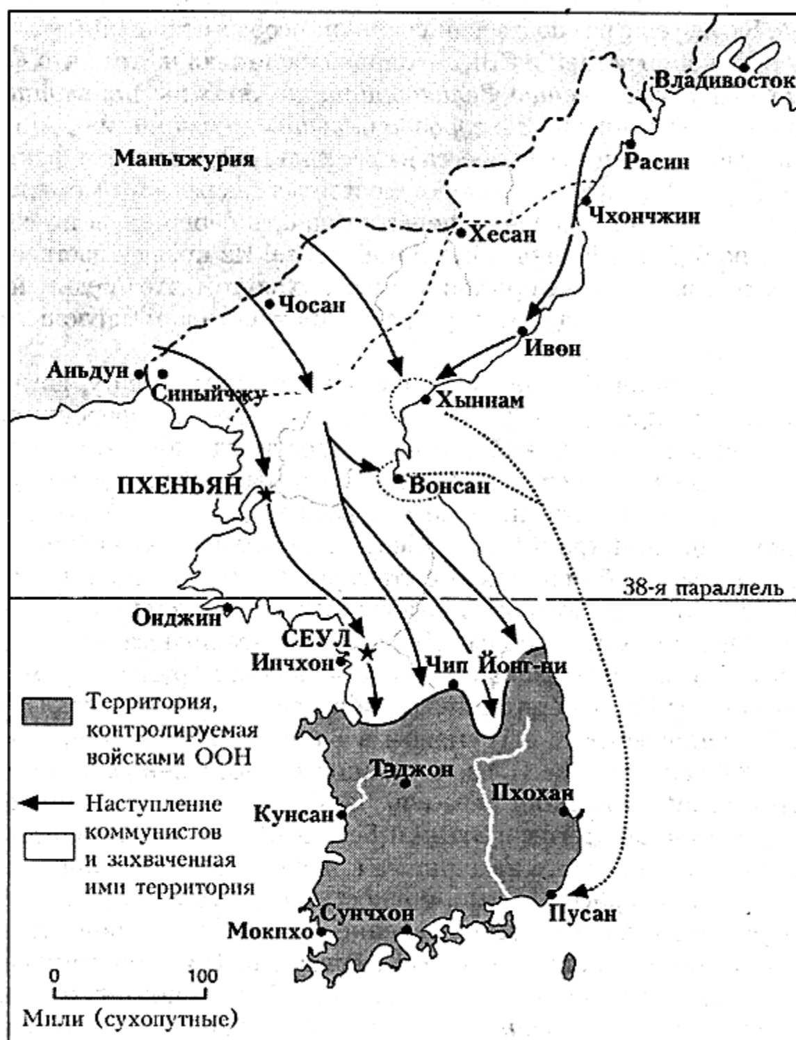
Боевые действия с ноября 1950 по январь 1951 года.