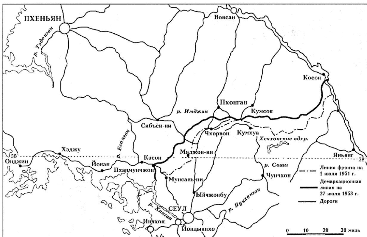
Положение в период с 1 июля 1951 года по 2 июля 1953 года.