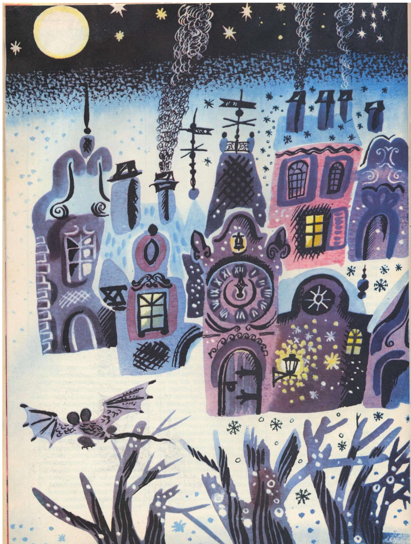
Рисунки А. АЗЕМШИ.