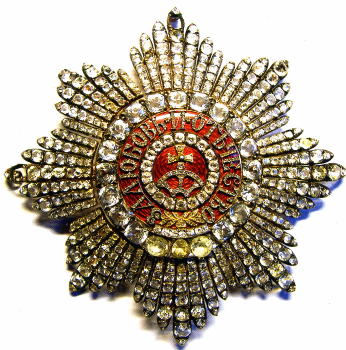
▲ Звезда ордена Св. Екатерины, первая половина XIX в. ГИМ.