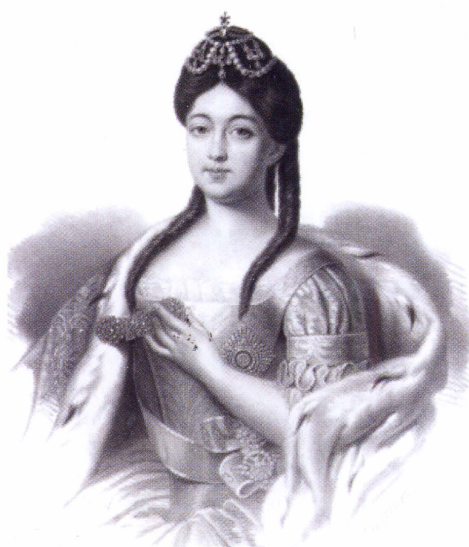
▲ Цесаревна, герцогиня Голштейн-Готторпская Анна Петровна (1708–1728). Награждена 21 мая 1725 г.

А через два года этот орден получили обе дочери Меншикова, Мария и Александра, и сестра его жены Варвара.