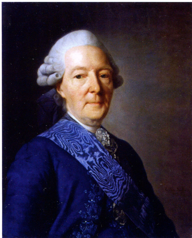
▲ И. И. Бежкой (1704–1795) – личный секретарь императрицы Екатерины II (1762–1779), президент Императорской Академии искусств (1763–1795), государственный деятель. Портрет работы А. Рослина (1777 г.), Эрмитаж.

возложила на их милостей, в это время, согласно здешнему обычаю, преклонивших колена». По-видимому, в обоих случаях «награждения» юношей, еще не вышедших во взрослый возраст – Сапеге было 15 лет, Меншикову – 13, имела место придворная шутка; других объяснений подобным актам «награждений» нет.