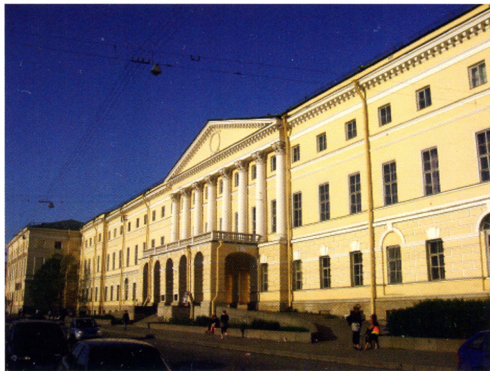
▲ Здание училища в наши дни. Набережная реки Фонтанки, дом 36. Архитектурный стиль – классицизм. Строительство: 1800–1801 годы. Орденская принадлежность – орден Святой Екатерины (1845–1917г) Здание сохранилось. Охраняется государством.

С 1845 г. орденской стала церковь св. Великомученицы Екатерины при училище ордена Св. Екатерины (Санкт-Петербург, набережная реки Фонтанки, 36). Поначалу училище занимало деревянный дом против Таврического дворца, где 25 мая 1798 г. была освящена небольшая домовая церковь. В октябре следующего года училище переехало в здание на углу Загородного проспекта и Чернышева переулка, куда перенесли и храм. В 1800 г. училищу передали бывший Итальянский дворец на