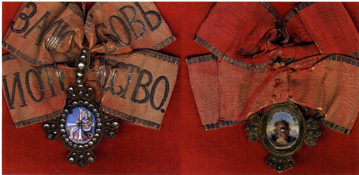
▲ Орден Св. Великомученицы Екатерины, 1841 г.

Император Александр I передал все орденские командорства (земли и деревни) управлению губерний. Часть доходов с земель шла на пенсионные нужды. Другая часть доходов шла на благотворительные учреждения, подведомственные Капитулу Орденов. После 1843 года денежные выплаты были названы пенсионом, составлено расписание пенсионных окладов, деньги для которых отпускались из Государственного Казначейства. Это расписание пенсий действовало до 1917 года.