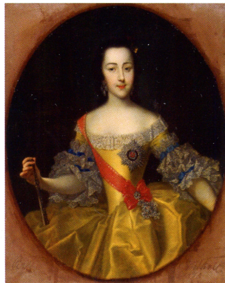
▲ Великая княгиня Екатерина Алексеевна (будущая Екатерина II) в 16 лет. Награждена 15 марта 1743 г.

Большинство кавалерственных дам получали награды, как правило, за военные и гражданские заслуги своих мужей, фамилии которых можно увидеть в списках кавалеров ордена Св. Андрея Первозванного.