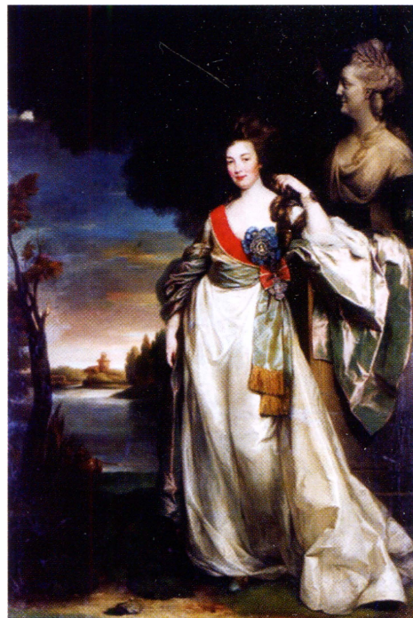
▲ Графиня А. В. Браницкая, статс-дама, супруга И.-К. Браницкого, польского коронного великого гетмана. Награждена орденом Св. Екатерины 20 марта 1787 г.

зина, со дня рождения коего ныне исполнилось сто пятьдесят лет, Мы с соизволения Государя Императора приняли Вас в число дам меньшего креста Св. Великомученицы Екатерины...»