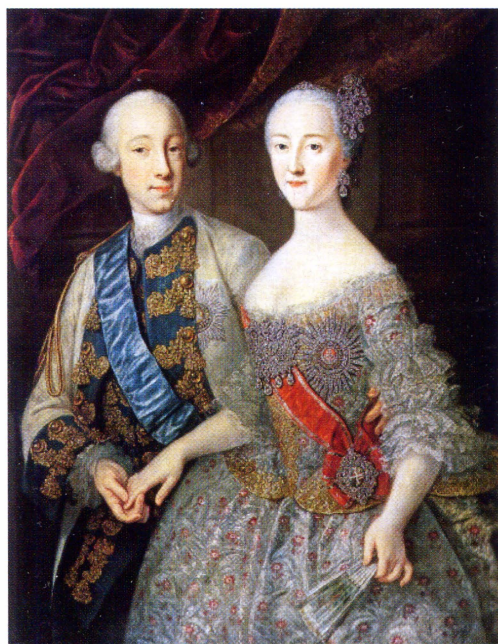
▲ Портрет великого князя Петра Федоровича и великой княгини Екатерины Алексеевны. Гроот Г. Х. 1745 г. Государственный Русский музей.