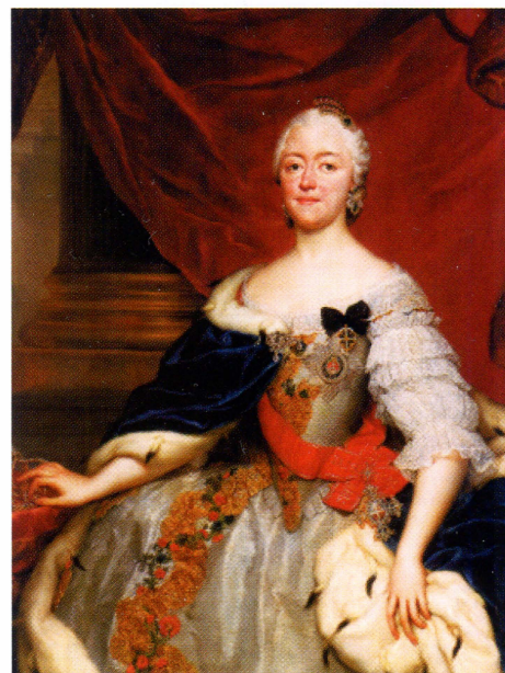
▲ Принцесса Саксонская Мария-Антуанетта (1724–1780) со знаками орденов Св. Екатерины и Звездного Креста (Австрия). Награждена 16 октября 1745 г.

Второй степенью ордена удостоены 500 женщин – 465 российских дам и 35 иностранных (в т. ч. 1 представительница Европейского Владетельного Дома – Милена Петровна).