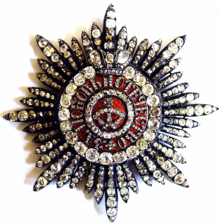
▲ Звезда ордена Св. Екатерины, вторая половина XIX в. Частное собрание.