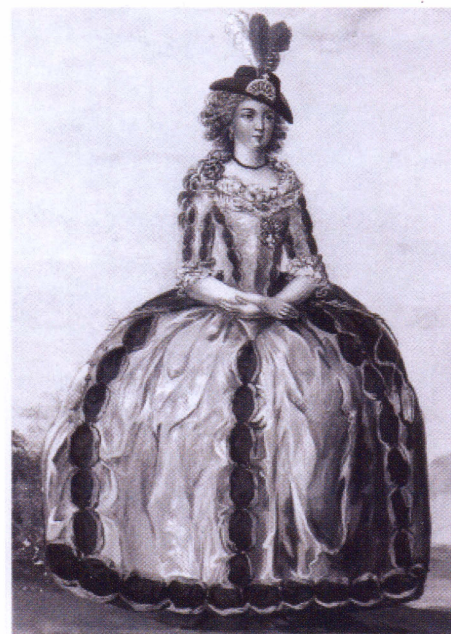
► Орденский костюм, 1779 г.

незначительно, о чем свидетельствует изображение кавалерственной дамы в «Придворном месяцеслове» 1779 года. Вместо четырех узких бархатных полос лиф платья украшался двумя широкими. Изображение в рост позволяет впервые увидеть юбку орденского платья, расшитую вертикальными бархатными полосами.