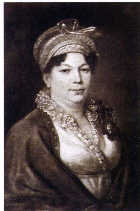
▲ Графиня А. И. Коновницына. Супруга героя Отечественной войны 1812 года графа П. П. Коновницына. Награждена 30 августа 1814 г.

Алексеевна Козловская, 1757–1824); 22 декабря 1801 г. – игуменья Казанского Богородицкого девичьего монастыря София (урожд. княжна Софья Борисовна Болховская, ?–1807); 10 ноября 1809 – игуменья Киевского Фроловско-Вознесенского монастыря Пульхерия (урожд. княжна Шаховская, ?–1812); 10 ноября 1809 г. – игуменья Тверского Рождественского монастыря Назарета Шванвичева (1762–1840); 6 декабря 1840 г. – игуменья Новгородского Свято-Духовского монастыря Максимила (урожд. Шишкина, 1768–1841).