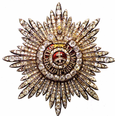
▲ Звезда ордена Св. Екатерины, середина XIX в. Г. В. Кеммерер, Л. К. Зефтиген. Частное собрание.