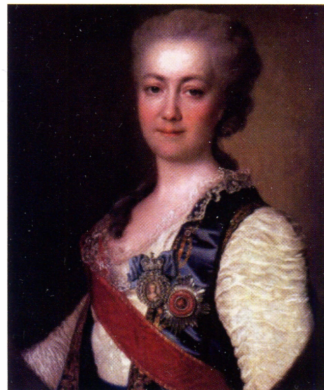
▲ Княгиня Е. Р. Дашкова, урожденная графиня Воронцова, статс-дама, директор императорской Академии наук, председатель Российской академии. Награждена 28 июня 1762 г.

Павел I предоставил дамам ордена Св. Екатерины управление Институтом воспитания благородных девиц «без родни, без имения и призрения, нередко в жертву пороков остающихся». В 1802 году такое же учебное заведение – училище (институт) ордена Св. Екатерины открылось в Москве. Для содержания училища дамы большого креста при пожаловании орденом вносили в кассу Капитула 800 рублей, а кавалерственные дамы – 200. Так как денег этих на содержание института не хватало, с 1798 года к этому добавились 8 тысяч рублей, выделяемые ежегодно из доходов, собираемых от орденских командорств. Каждая кавалерственная дама ордена Св. Екатерины могла представить воспитанницу для приема в училище ордена Св. Екатерины, «с тем однако же, чтобы представляемая происходила из дворянского рода, была совершенно здорова и имела положенные в учреждении сего Училища лета».