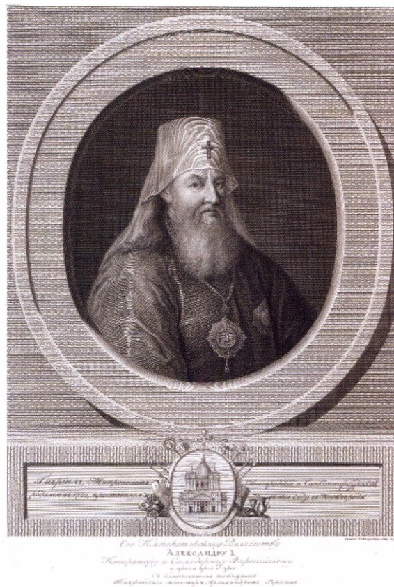
▲ Митрополит Гавриил. Гравюра Н. И. Уткина.

Как и всякое исключение из правил, награждения нескольких представителей мужского пола женским орденом кажутся удивительным фактом истории. Все свидетельства, относящиеся к XVIII столетию, когда орденская система еще не устоялась, основаны на воспоминаниях современников. Широко известен случай награждения 5 февраля 1727 года сына сподвижника Петра I светлейшего князя А. Д. Меншикова, Александра Александровича Меншикова (1714–1764) – «за то, что назывался при дворе «Demoiselle» по застенчивости его характера». Но, судя по мемуарной и исторической литературе, он был не первым и не последним кавалером-мужчиной ордена Св. Екатерины. Об одном из таких «награждений» свидетельствуют мемуары очевидца: «После обеда в три часа (22 марта 1726 г. – Ред.) их милости поехали во дворец ее императорской милости для прощания <...> И там после обычного поклонения ее величеству она вручила ордена – его милости г. старосте Бобруйскому (Яну-Казимежу Сапеге (?–1730). – Ред.) и теперь фельдмаршалу императорский [орден] Св. Андрея, а его милости г. старосте Мерецкому двоюродному брату фельдмаршала (Михаилу-Казимежу (1711–1760). – Ред.) самой ее императорской милости – Св. Екатерины. И сама ее императорская милость прикрепила эти ордена и