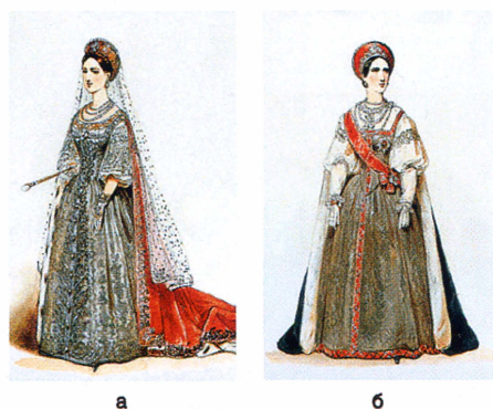
▲ Иллюстрация с проектными рисунками орденских костюмов 1855 г. А. Шарлеманя. Не были утверждены.

у Великих Княгинь и Великих Княжон Российских, также у Принцесс Коронованных Домов, с алмазами, а у прочих вышитые серебром. Ее Величество Императрица имеет сверх того зеленую бархатную с горностаеми епанчу».