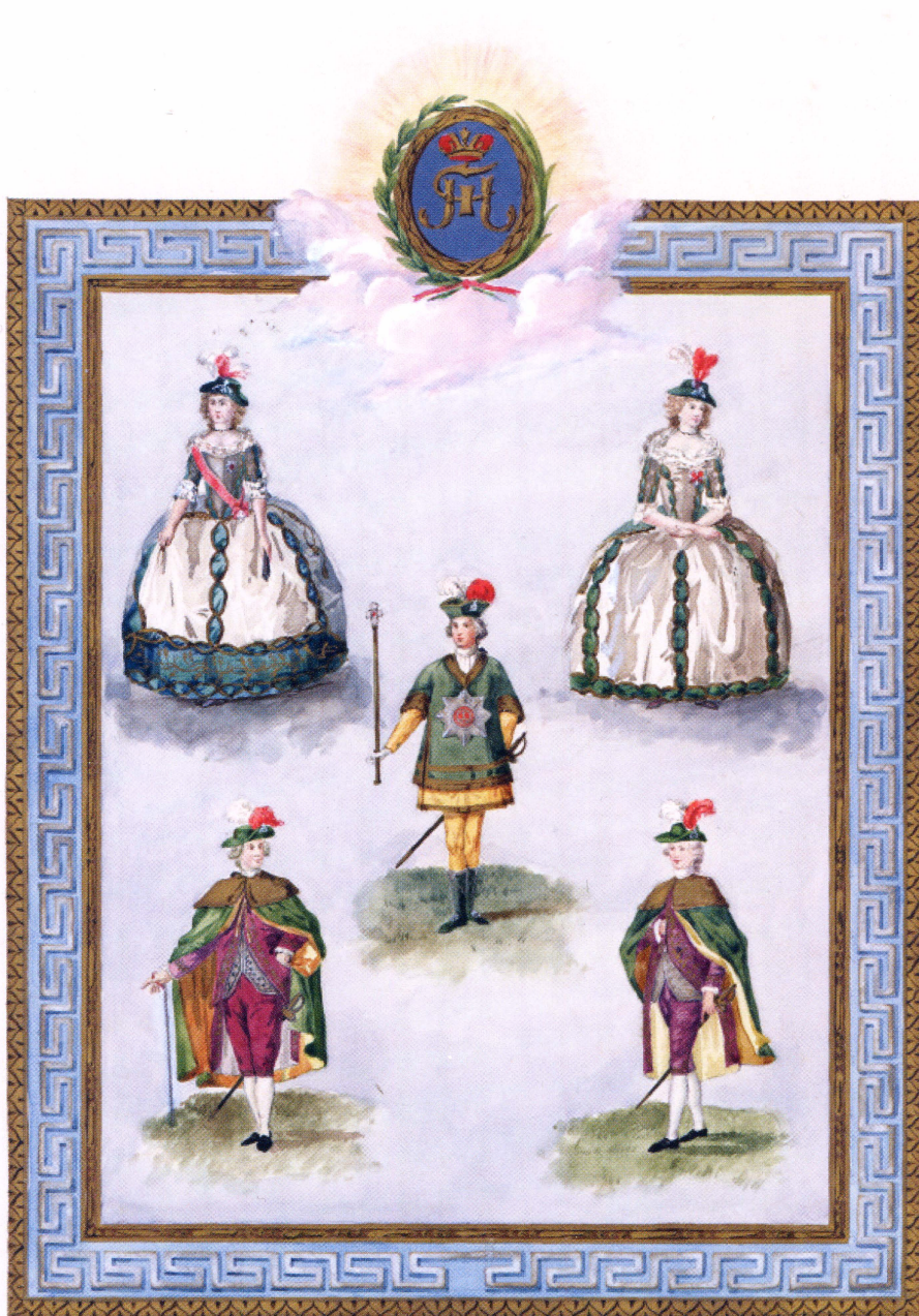
▲ Орденские одеяния кавалерственных дам и официалов св. Екатерины. Павловский Статут 1797 г.