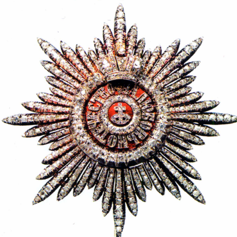
▲ Звезда ордена Св. Екатерины, конец XIX в. Частное собрание.

Знак ордена Святой Великомученицы Екатерины 2-й степени носился на груди слева.