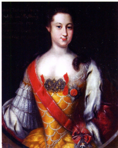
▲ Анна Леопольдовна, регент при императоре-младенце в 1740–1741 гг. Награждена 12 мая 1733 г.