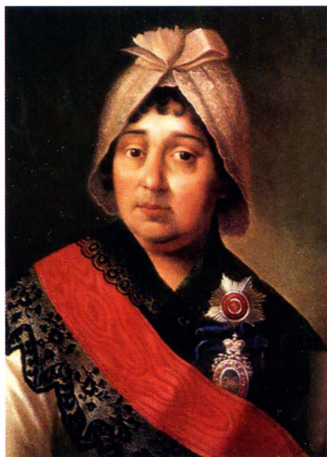
▲ Графиня В. И. Суворова-Рымникская (1750-1806). Супруга А. В. Суворова, величайшего русского полководца. Награждена 15 сентября 1801 г.

С 1836 года из всех фрейлин 36 считались «комплектными», и состояли при императрицах, великих княгинях и великих князях. По выходе замуж фрейлины отчислялись со двора.