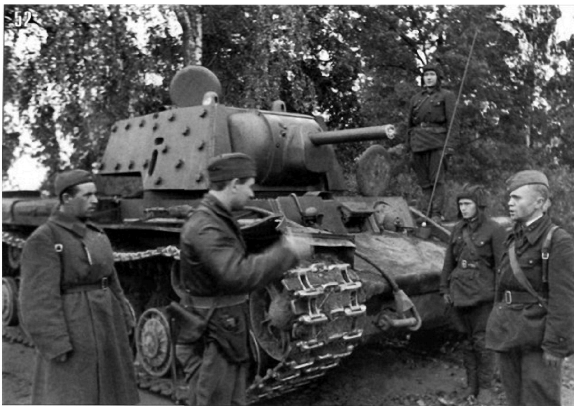
Фото 11-12. Танкисты 121-й танковой бригады и артиллеристы Брянского фронта. Август-сентябрь 1941 г.