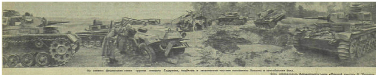
Фото 2. Там же, после удара советских лётчиков