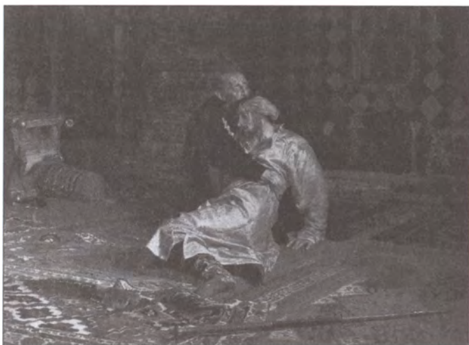
Иоанн Грозный и его сын Иван. Художник И.Е. Репин