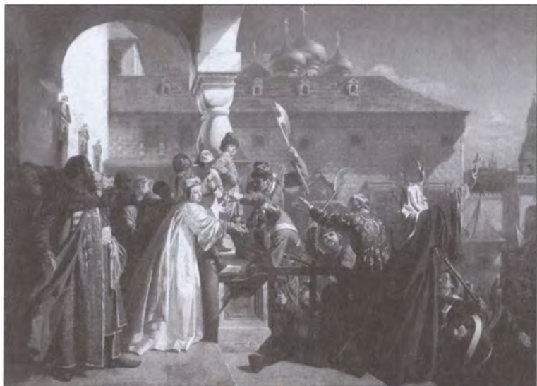
Стрелецкий бунт. Художник Н.Д. Дмитриев-Оренбургский