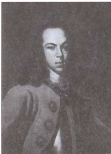
Царевич Алексей Петрович. Художник И.-Г. Таннауэр