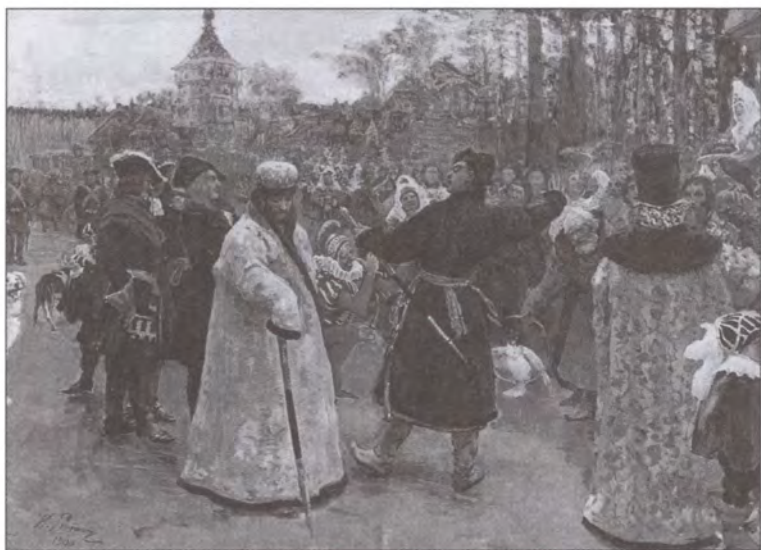
Приезд царей Петра и Иоанна. Художник И.Е. Репин