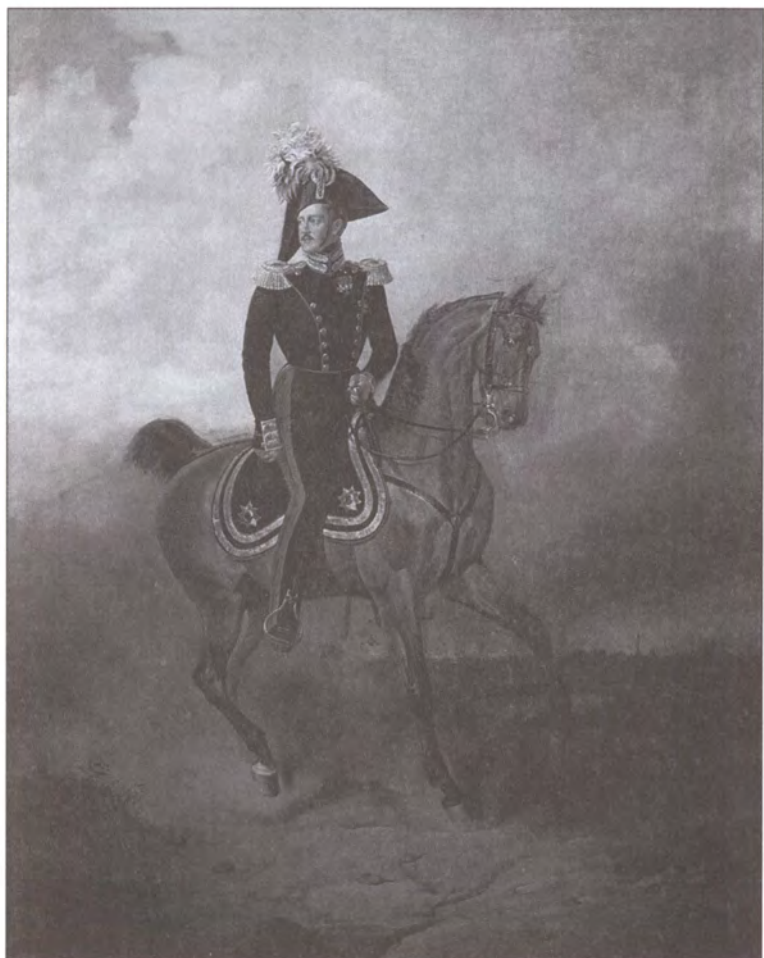
Император Николай I на коне. Художник В.Ф. Тимм