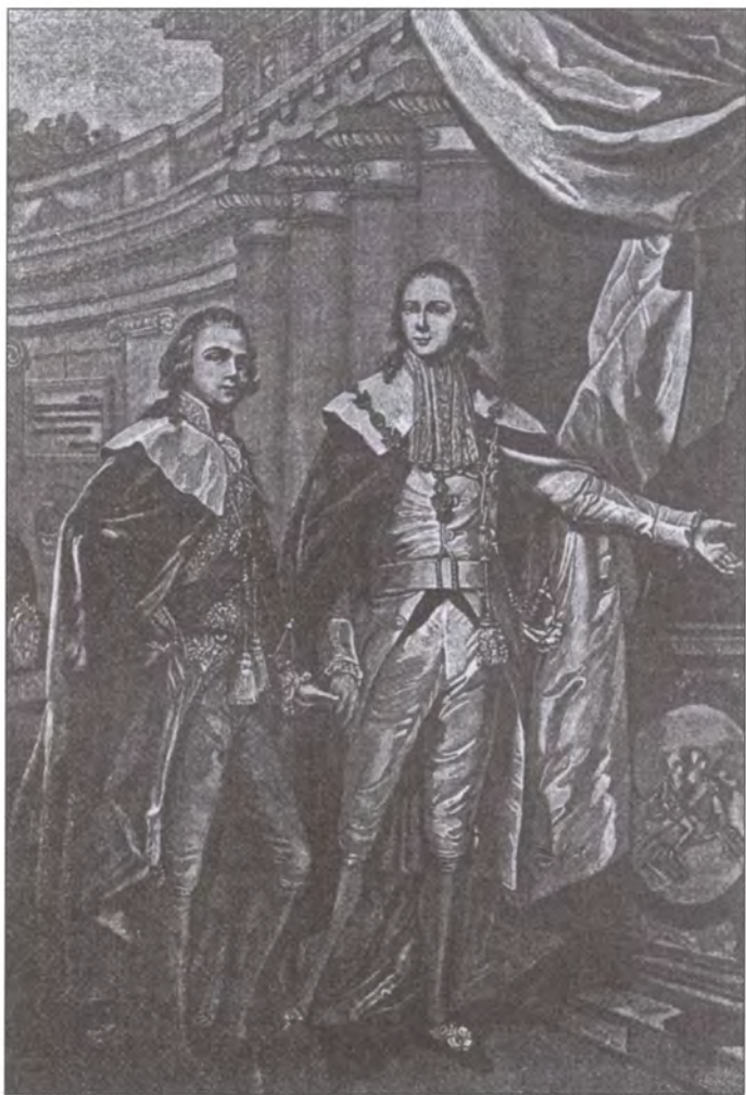
Великие князья Александр и Константин Павловичи. Неизвестный художник