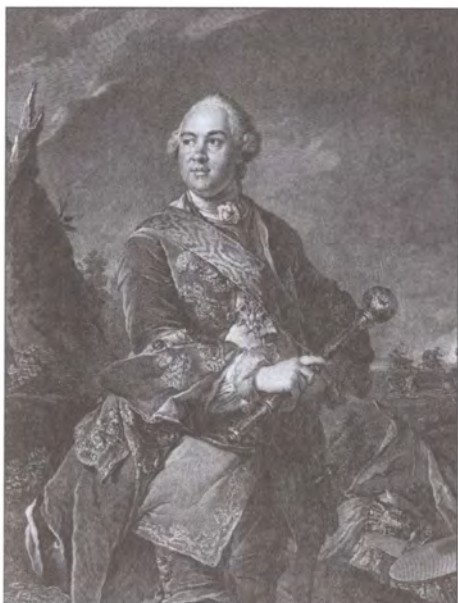
Граф К.Г. Разумовский Художник Г.Ф. Шмидт