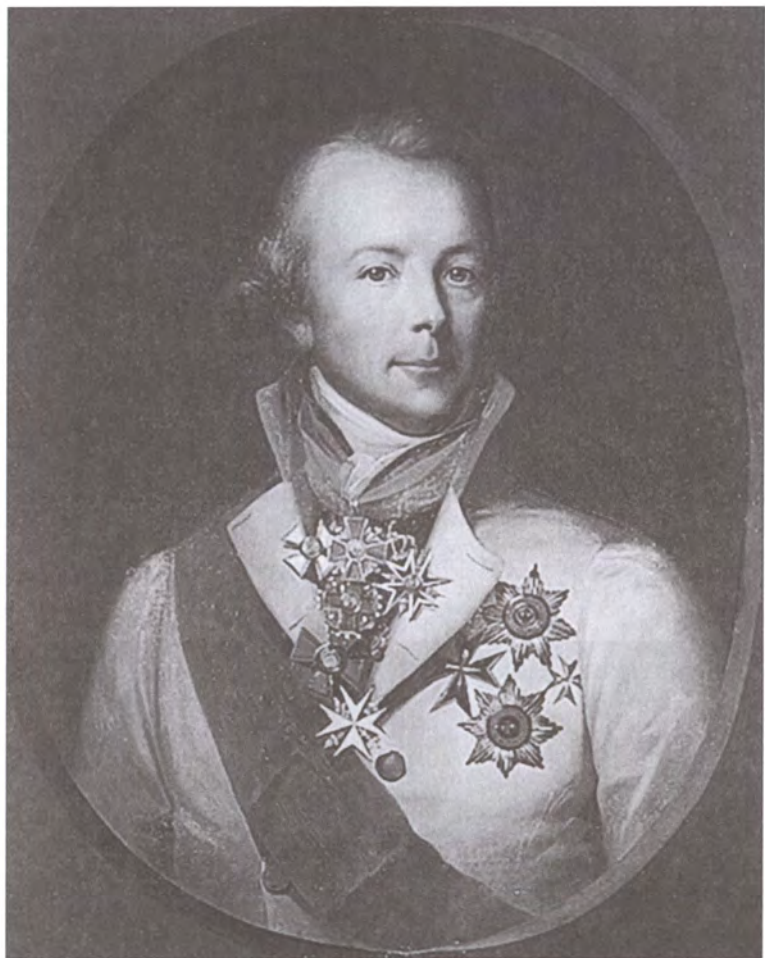
Граф П.А. фон дер Пален. Неизвестный художник