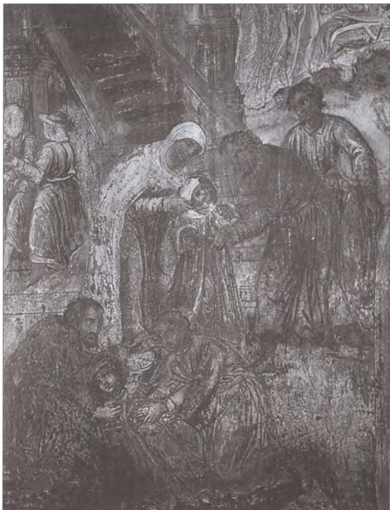
Убийство царевича Димитрия. Роспись церкви Царевича Димитрия «на Крови»