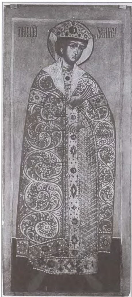
Царевич Димитрий. Икона XVII в.