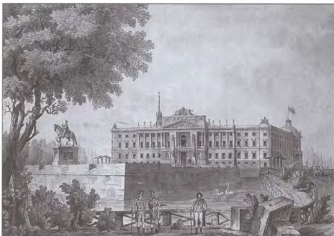
Михайловский замок. Художник Дж. Кваренги