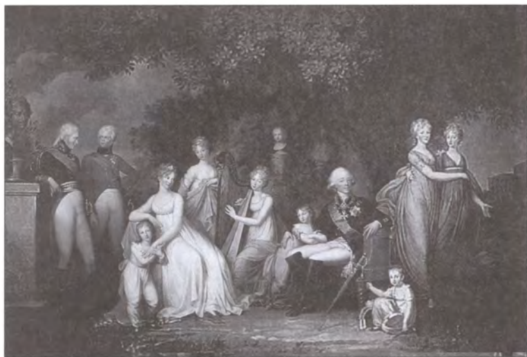
Император Павел I с семьей в Павловском парке. Художник Г.-Ф. фон Кюгельген