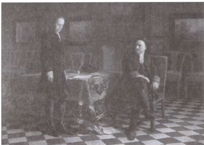
Петр I допрашивает Царевича Алексея Петровича в Петергофе. Художник Н.Н. Ге