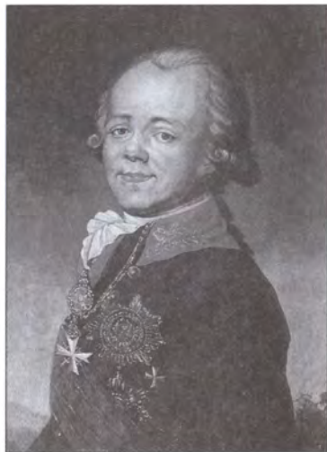
Император Павел I. Неизвестный художник