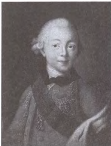
Великий князь Павел Петрович. Художник А.П. Антропов