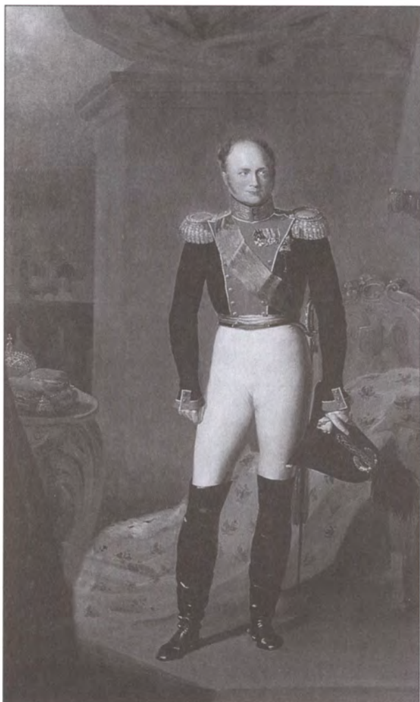
Император Александр I. Художник В.Г. Голике