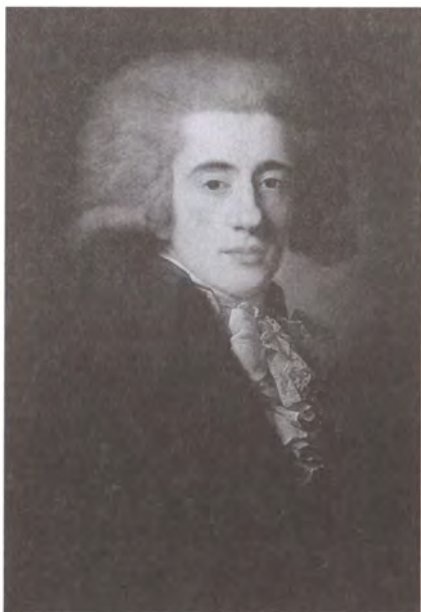
Граф Н.П. Панин. Художник Ж.-Л. Вуаль