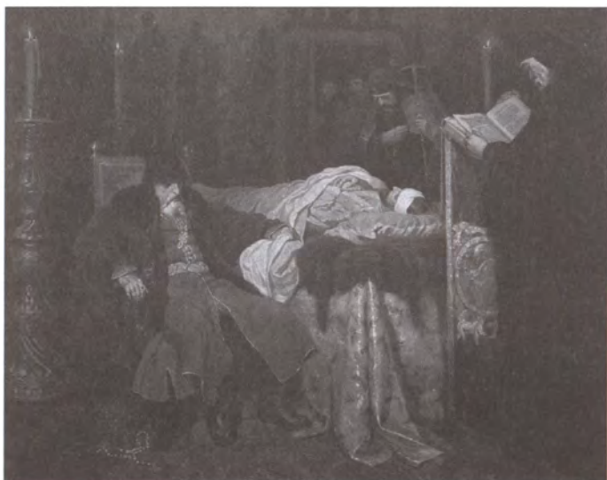
Иоанн Грозный у тела убитого сына. Художник В.Г. Шварц