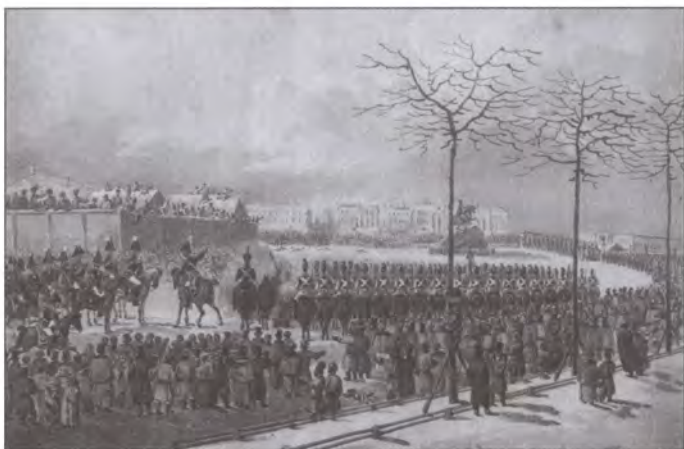
Восстание на Сенатской площади 14 декабря 1825 г. Художник К.И. Кольман