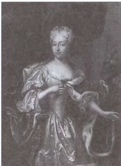
Шарлотта Христина София Вольфенбюттельская. Художник И.П. Людден