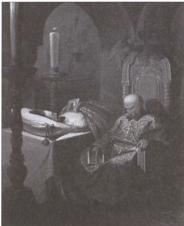
Иоанн Грозный у тела убитого им сына. Художник Н.С. Шустов