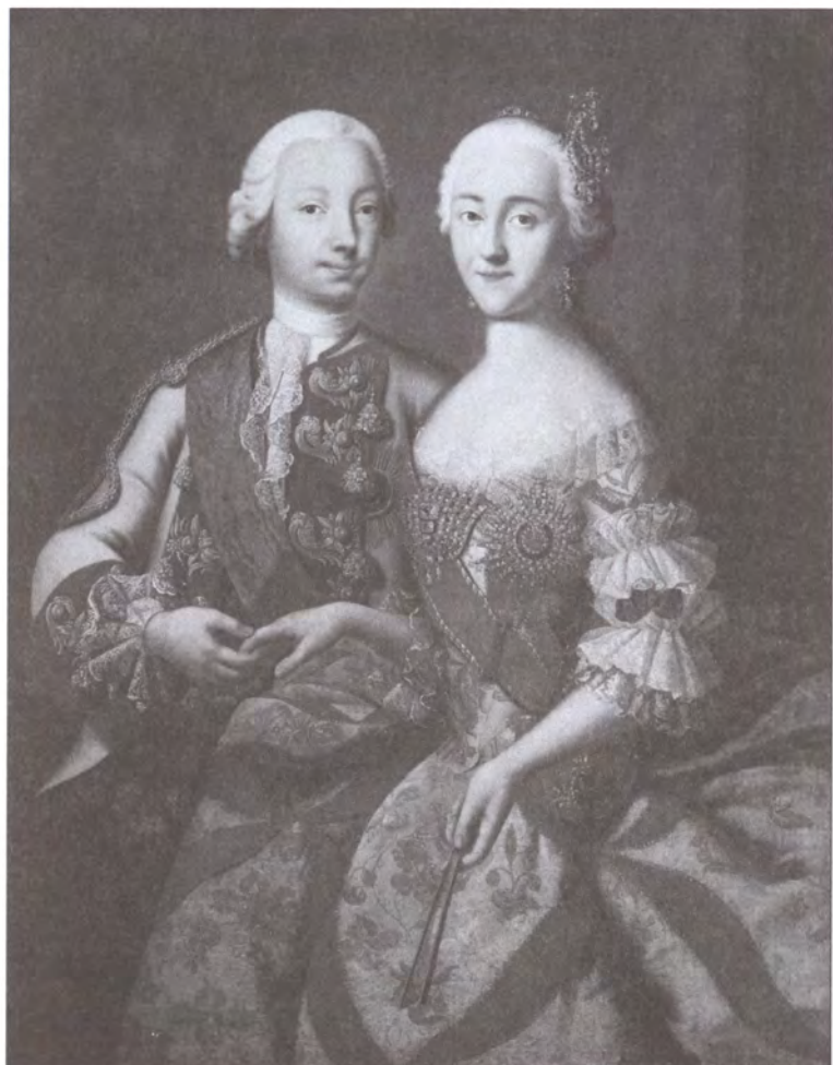
Портрет цесаревича Петра Фёдоровича и великой княгини Екатерины Алексеевны. Художник Г. Гроот