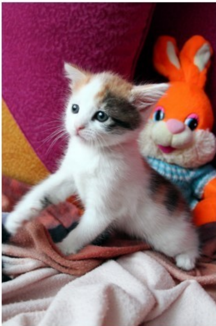
Малышка Туся осваивается в новом доме