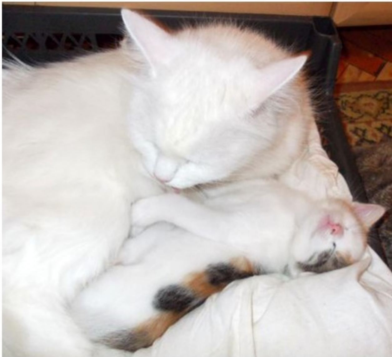
Последний сон Ту сечки в объятиях своей мамы. Но нужно расстав

А однажды в доме появился маленький котёнок. Я таких ещё никогда не видел. Но он меня удивил быстротой освоения домашних правил и своей общительностью. Это была девочка, в которой угадывалось сходство с Сясей по расположению чёрных и рыженьких, солнечных пятен на белой шёрстке. Мы были заинтригованы предположением о будущем рисунке на спинке, который меняется в первые месяцы, может проявить полосы и пятна; нас интересовало повторит ли он очертания пингвина, как это было у Сяси. И имя котёночку дали такое, которое просто указывает на то, что это вторая Сяся: Туся, ведь имя Сяся состоит из двух одинаковых слогов "ся", или "2ся", только с английским прочтением цифры 2 это звучит "Туся".