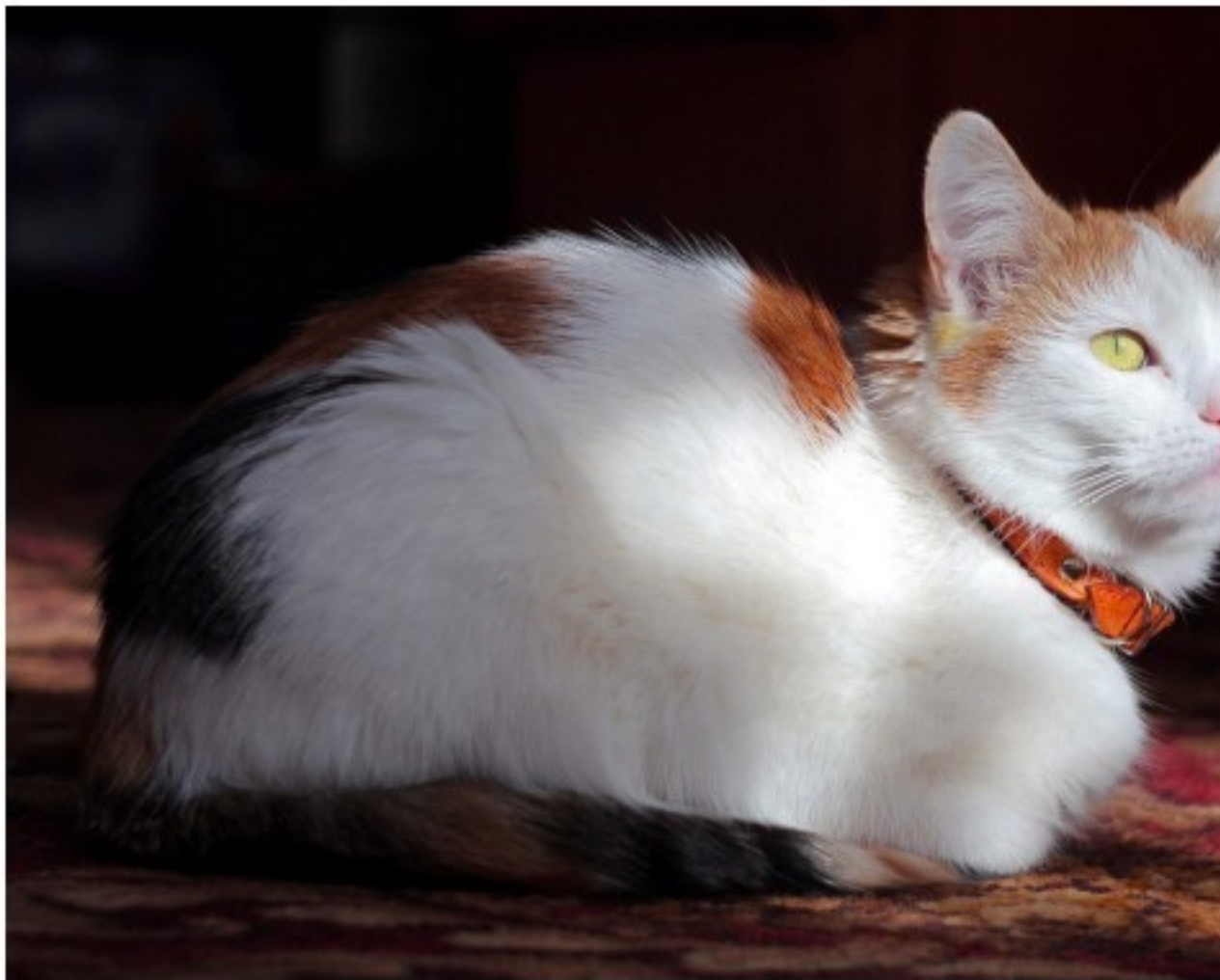
Тусечке очень нравится ошейник.

Вспоминая себя в её возрасте, я точно помню свою неприязнь к ошейнику, однажды я всем показал, чтобы не приставали ко мне со своей обновкой на шее: я так отчаянно боролся с ней, что это похоже было на сражение до бесчувствия. Такой результат не устраивал никого, и мне дали свободу, а со временем, я даже не понял, как это произошло, я спокойно разгуливал на поводке с ошейником. Зато Туся меня удивила своей нескрываемой радостью по поводу надетого на неё ошейника. Она его полюбила, носила и слушала мелодию колокольчика, играя с ним. И мой светящийся ошейник она носит с удовольствием. Просто дома, не снимая, разгуливает, играет и спит – ей с ним уютно. Надо отметить, что ей очень нравится примерять мою одежду, и в своей любит пощеголять.