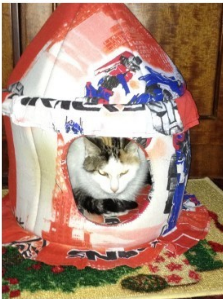
Сяся очень любила этот домик.