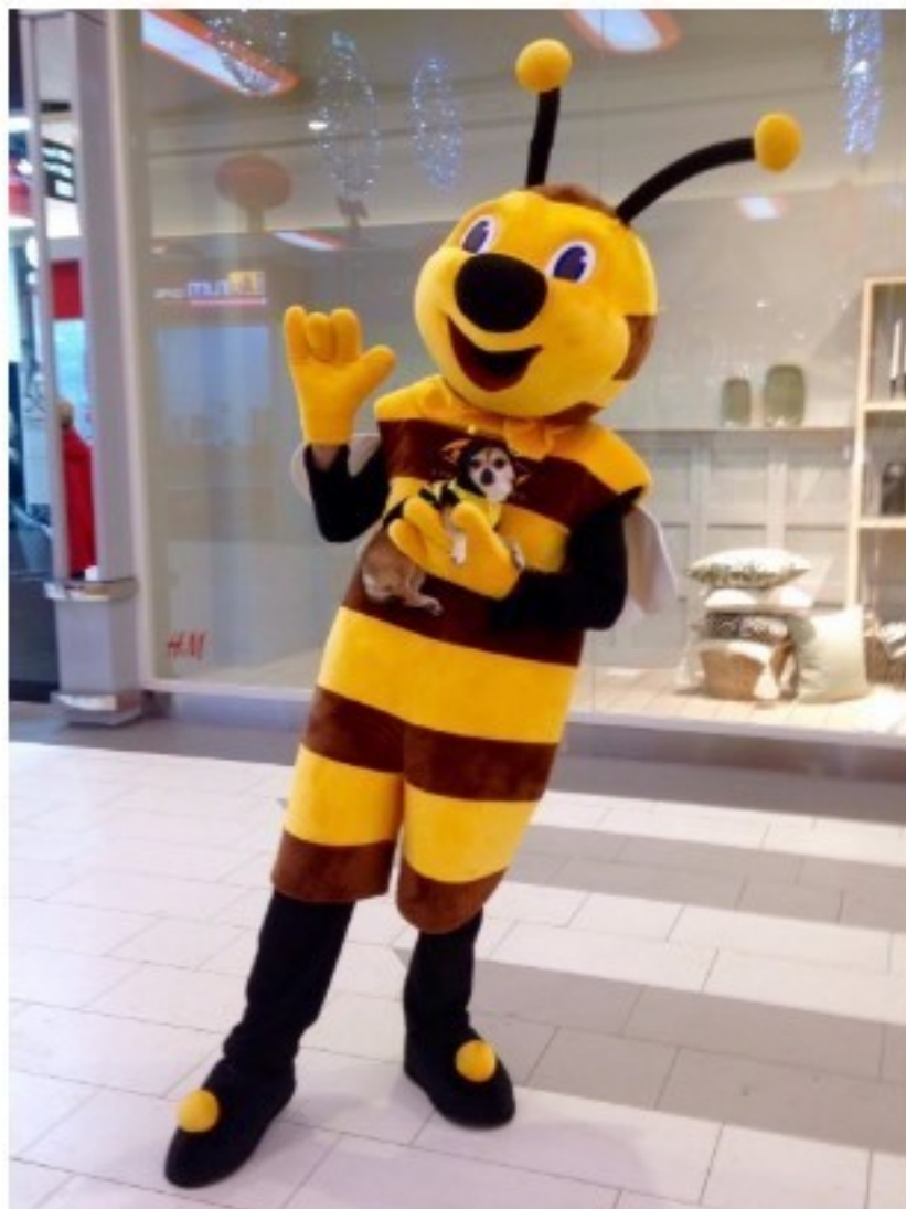
Я в костюме пчёлки в лапке у большой пчелы.

У меня может быть странное имя – Малыш, но это отражает и мой миниатюрный вид, который вполне нормальный для собак моей породы чихуахуа, и открытый доброжелательный, приветливый характер с непосредственностью щенка. Нет, я не остановился в развитии, просто мой жизненный девиз соответствует поддержанию состояния любви и радости. Внешнее проявление этого настроения роднит со щенком, но огромная разница состоит в том, что маленькие, здоровые или, не ощущающие боль, детёныши неосознанно пребывают в таком состоянии, а при взрослении, что происходит достаточно быстро, и при получении жёстких негативных впечатлений, появляется насторожённость, ожидание подвоха, угрозы и агрессия. У взрослых только осознанные волевые действия могут поддерживать состояние радости жизни. А любовь в душе придаёт ощущение ценности жизни, расцветивает её божественными красками в звучании волшебной мелодии счастья, способна изгнать и закрыть врата тяжёлым недугам, исцелить, наполнить жизнь благоприятными возможностями.