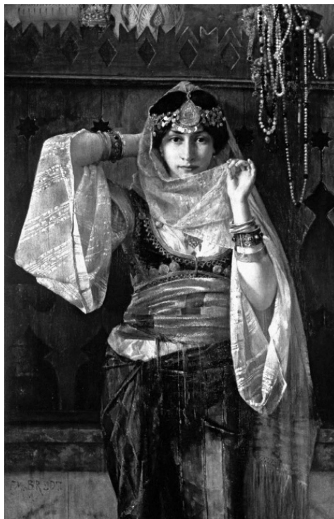
Королева гарема. Фердинанд Макс Бредт. Ранее 1921 г.

– Как тёмная ночь черны волны её благоухающих волос. Как молния блещут глаза. Бледно прекрасное лицо. Только избраннику улыбнётся она, черноокая, чернокудрая, грозная красавица, которая живёт там, за дремучим лесом, за высокими горами.