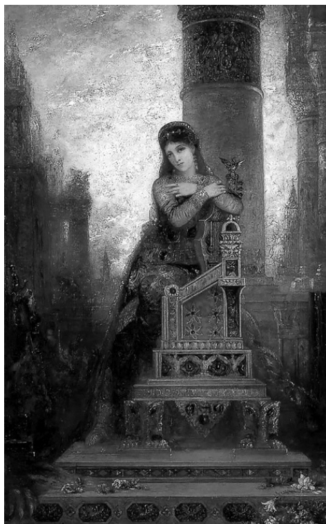
Дездемона. Гюстав Моро. 1880-е гг.

Истине пришло в голову попасть во дворец. Во дворец самого Гарун-аль-Рашида.