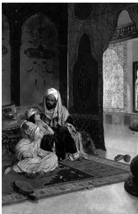
Фаворитка султана. Рудольф Эрнст. 1890-е гг.

– А почему бы и нет? Много гурий в раю пророка, много красавиц в земном раю – в гареме халифа. В садах пророка не была бы я последней из гурий, среди жён падишаха я, быть может, была бы первой из жён и среди одалисок – первой из его одалисок. Где кораллы ярче моих губ, и дыхание их – как воздух полудня. Стройны мои ноги, и как две лилии – грудь моя, – лилии, на которых выступили пятнышки крови. Счастлив тот, кто склонит голову на мою грудь. Чудные сны приснятся ему. Как луна в первый день полнолуния, светло лицо моё. Как чёрные бриллианты горят мои глаза, и тот, кто в минуту страсти заглянет в них близко-близко – как бы велик он ни был! – увидит себя в них таким маленьким, таким маленьким, что рассмеётся. Аллах создал меня в минуту радости, и вся я – песнь своему творцу.