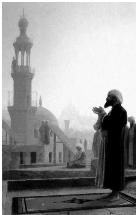
Молитва в Каире. Жан-Леон Жером. 1865 г.

Евнух улыбнулся так, как улыбаются евнухи и жабы.