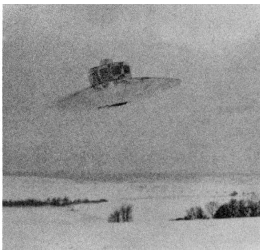
Испытательный полет летающего диска

У нацистов было десять различных оружий возмездия – от «ФО-1» до «ФО-10». «ФО-7» относились к дисколетам, «ФО-1» – к беспилотным маленьким самолетикам с пульсирующим двигателем, а «ФО-2» – это ракета, на то время самая крупная в мире.