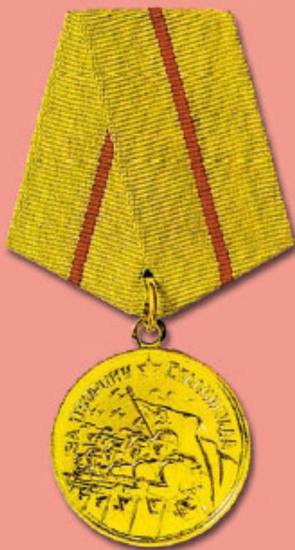
Медаль «За оборону Сталинграда»