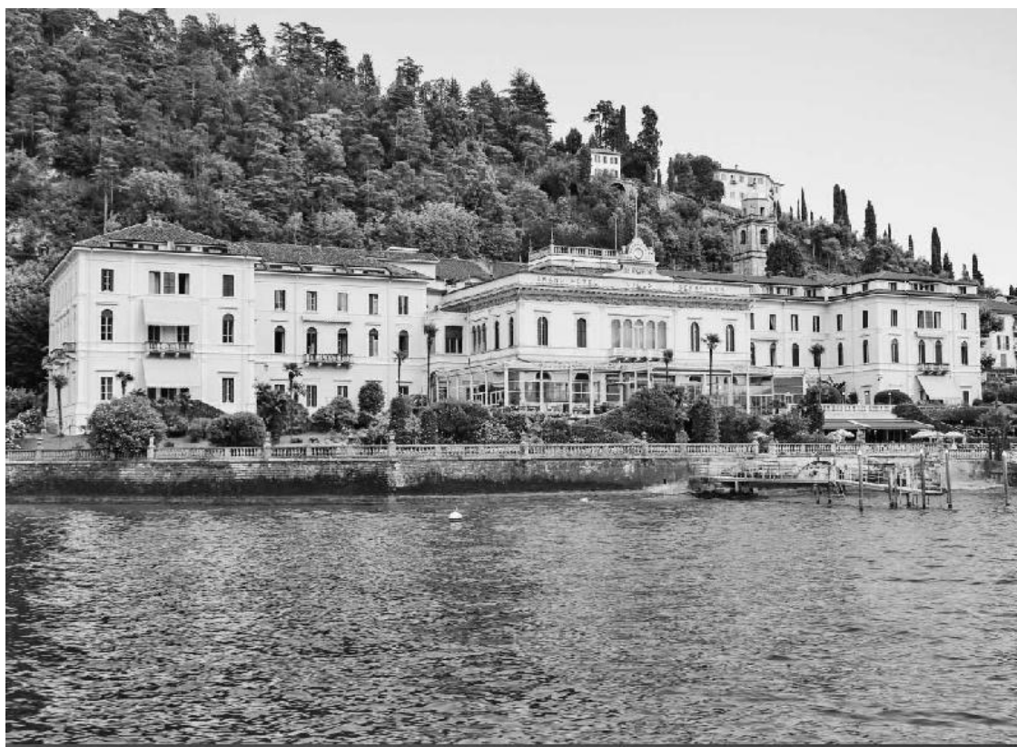
Имение Рокфеллеров на берегу озера Комо в городе Боладжио

В одном из самых живописных мест Италии, на берегу озера Комо в городе Боладжио, находится имение Рокфеллеров, в котором расположен одноименный рокфеллеровский фонд и где проходят съезды экологов и меценатов. Самое интересное заседание в Боладжио произошло в далеком 1972 году, когда влиятельное семейство вместе с другими представителями финансовой элиты основали здесь могущественную организацию под названием «Рим-