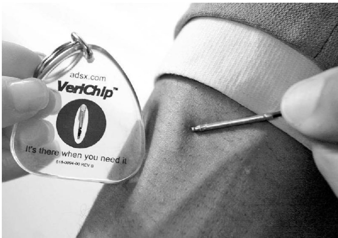
VeriChip – RFID микрочип, который имплантируется человеку под кожу