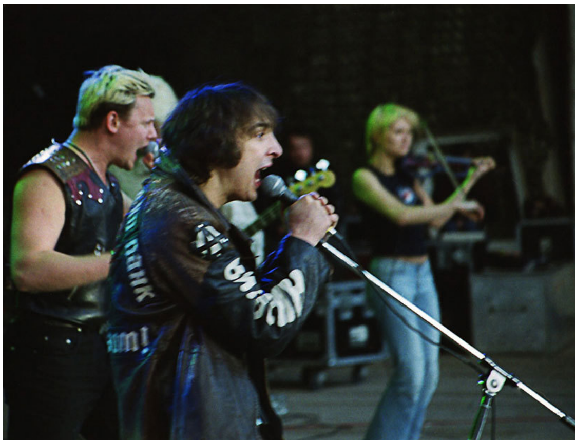
Горшок, Князь и Маша в Зеленом театре, 13 июня 2003 года.