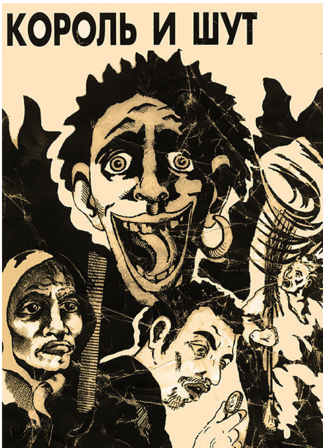
Афиша «Король и Шут» в клубе ТаМтАм, 1993 год