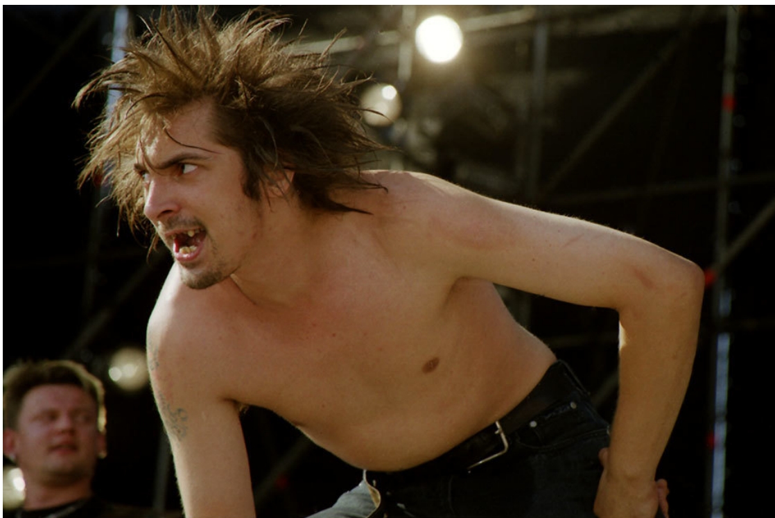
Горшок на фестивале «Нашествие», 2001 год.