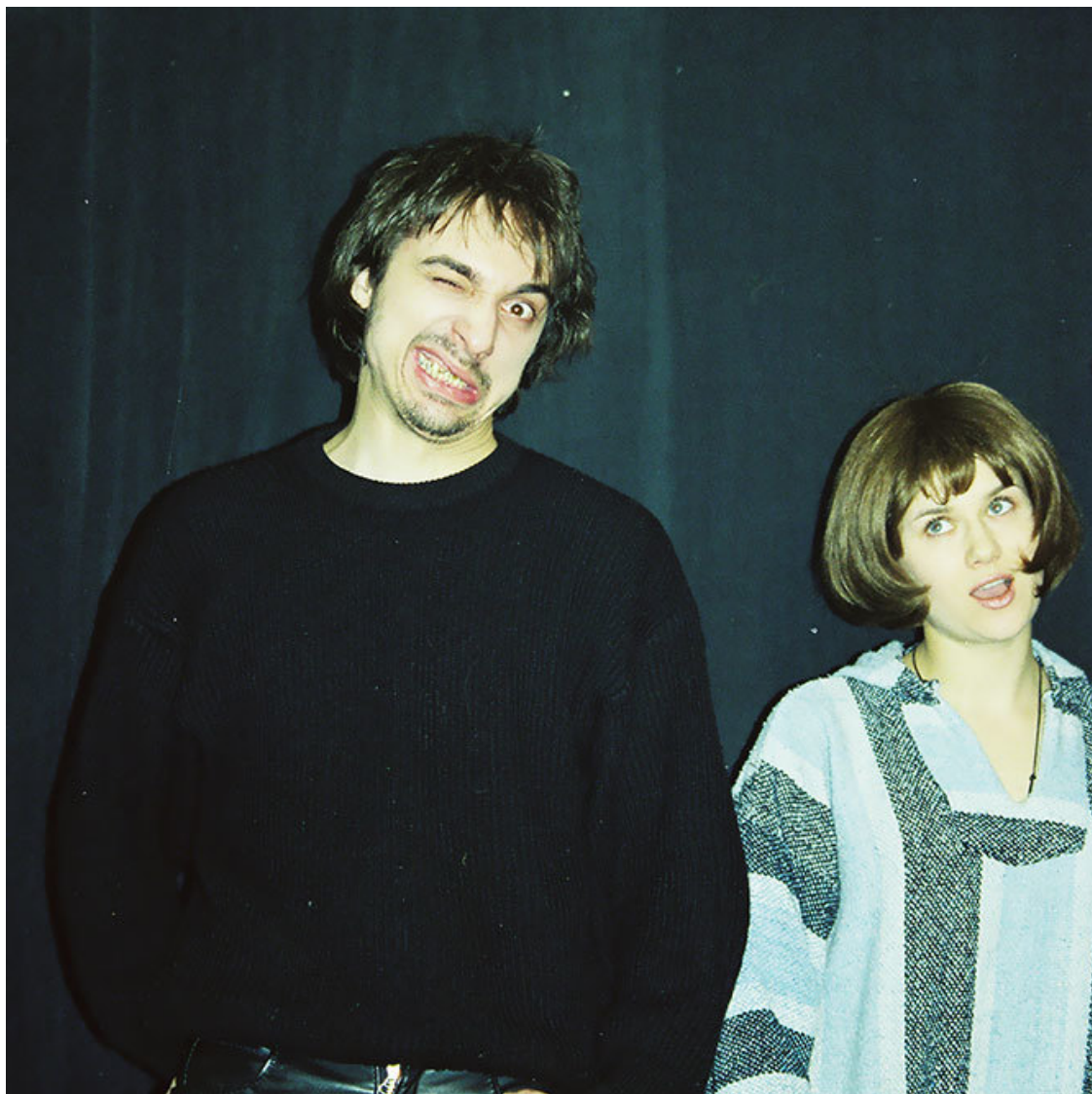
Горшок и Маша в ДК им. Кирова. Санкт-Петербург, 1998 год.