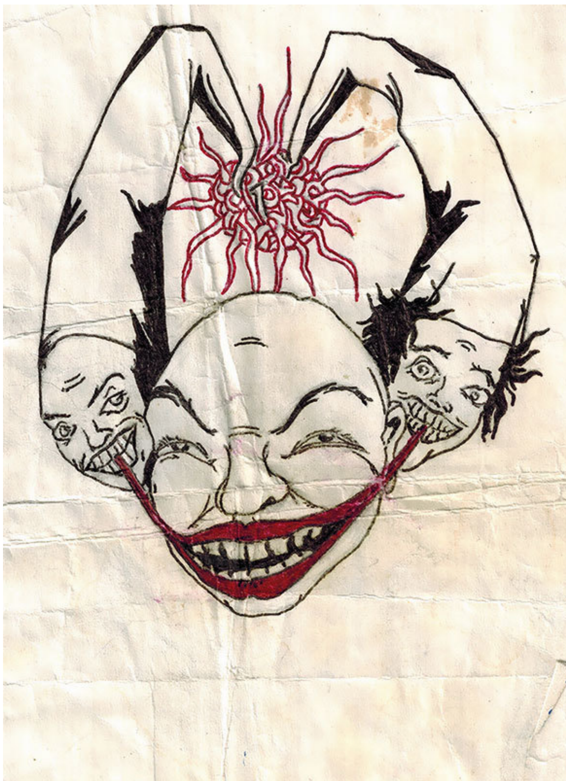
Рисунок М. Горшенева