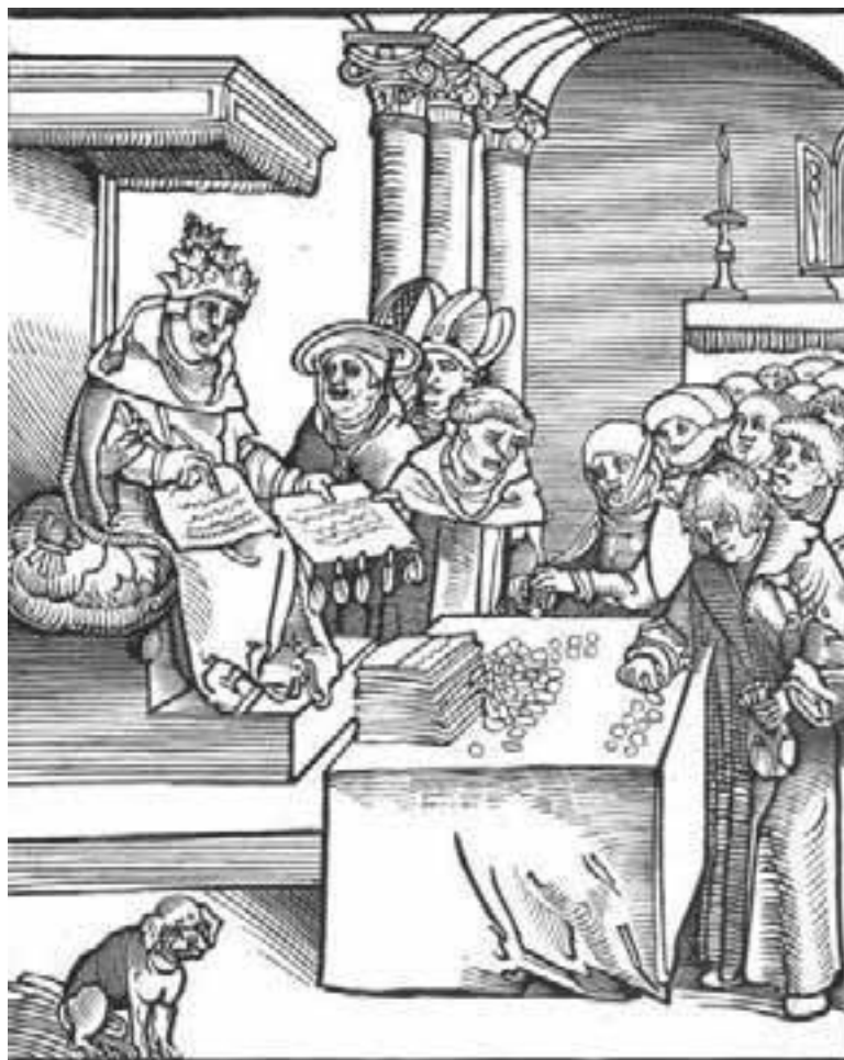
«Антихрист» Лукас Кранах-Старший

Со временем люди (в первую очередь, христиане) стали понимать, что, кроме того антихриста, о котором написано в Апокалипсисе, могут быть так называемые «малые антихристы». Они вполне закономерны. Они предвеляют путь «большому антихристу» последнего времени и одновременно служат напоминанием христианам о последних временах, заставляя их быть бдительными и трезвыми. Ещё апостол Иоанн говорил о неизбежном явлении многих «антихристов» (1 Ин. 2:18). А наш русский мыслитель Лев Тихомиров называл таких «малых антихристов» «частичными», которые ещё будут являться людям до прихода «большого антихриста». Он справедливо отмечал, что «частичные» «антихристы» всегда обладали политической властью и использовали её для открытых или скрытых гонений на Церковь.