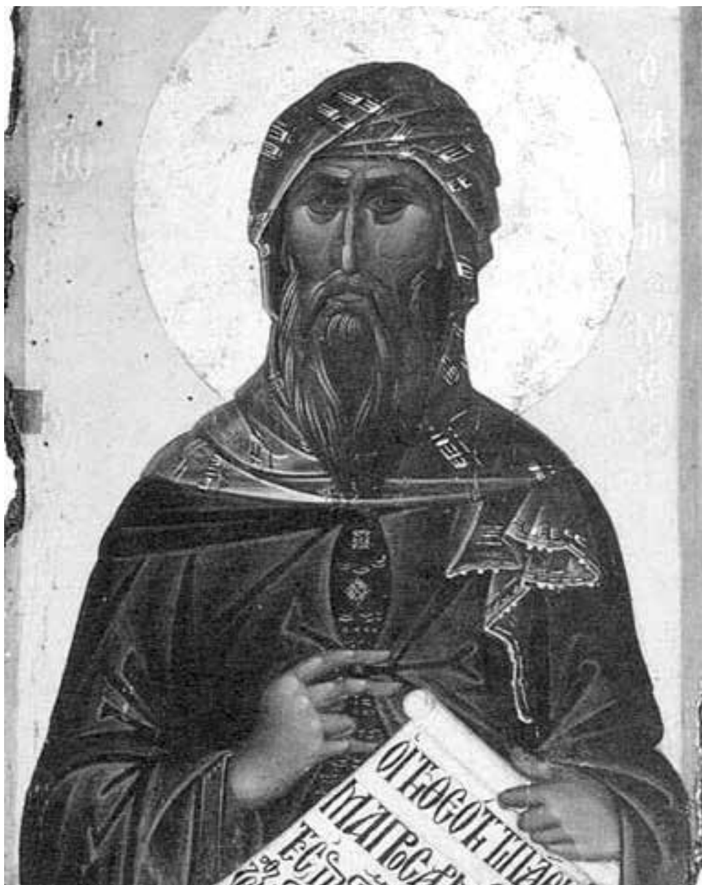
св. Иоанн Дамаскин

Эта история являет пример, как христиане должны реагировать на акции подобного рода со стороны лжепророков.