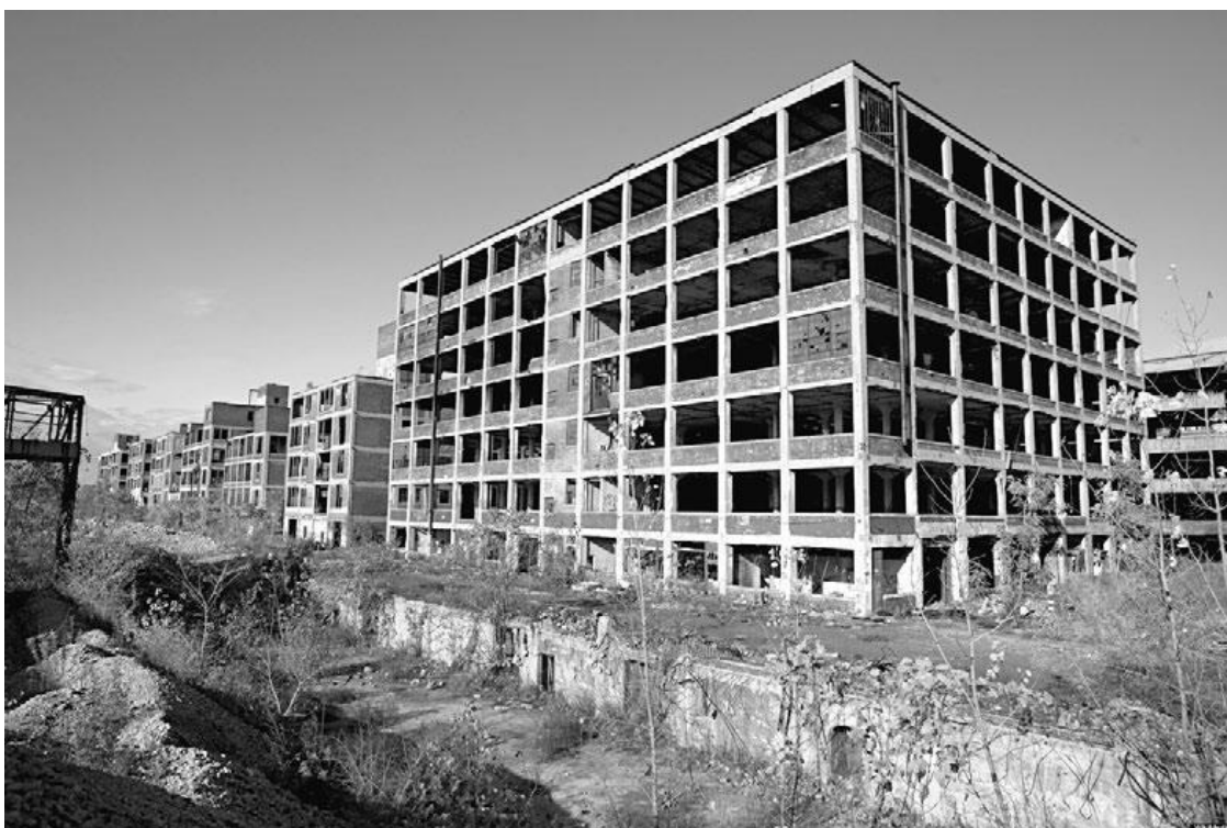
Автомобильный завод Packard. Некогда он был визитной карточкой Детройта

Добро пожаловать в Детройт, самый черный, мрачный и криминальный город США, столицу наркоторговли, убийств, поджогов и насилия. Оказавшись здесь, понимаешь истинное значение слова «безысходность». Именно на этих улицах вырос самый успешный музыкант тысячелетия, рэпер, прославившийся под именем Eminem. Вот уже более пяти десятилетий этот город называют проклятым. Все, кому посчастливилось окончить среднюю школу и не подсесть на наркотики, стараются поскорее уехать отсюда. Впрочем, счастливчики слишком рано радуются. Большинство из них так и не решаются покинуть этот город. Ну а многие вернутся. Причем не на роскошном лимузине и в дорогом костюме, чтобы утереть нос всем, кто насмехался над ними. Нет. Большинство возвращаются сюда, чтобы устроиться на работу в закусочной или супермаркете, а затем благополучно потерять работу и пополнить ряды безработных Детройта. По статистике, каждый пятый житель здесь живет на пособие, а каждый десятый – преступник. По ощущениям, статистика явно занижена.