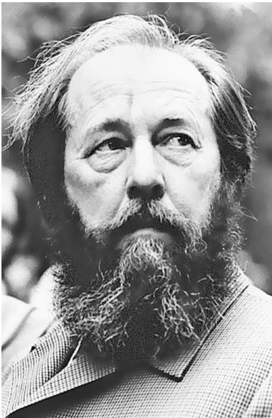
Александр Исаевич Солженицын – писатель, публицист, общественный и политический деятель, лауреат Нобелевской премии. 1970 г.