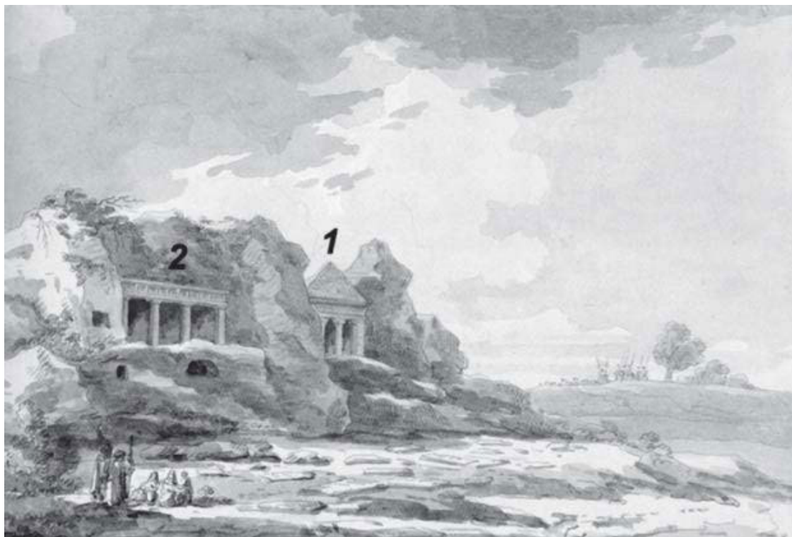
Рис. 3. Долина Кидрона. ГТГ, инв. 6491. Воробьев изображает проход между колоннами фасада «гробницы Захарии» (цифра 2 на рисунке), очевидно по аналогии с соседней гробницей священнического рода Хезир (цифра 1 на рисунке). На самом деле, «гробница Захарии» вырублена из скального монолита и имеет декоративные полуколонны на фасаде, но никакого прохода между ними нет.

дгийскому мирному договору. Переночевав в греческом монастыре в Яффе, миссия выехала вечером 3 сентября в Иерусалим.