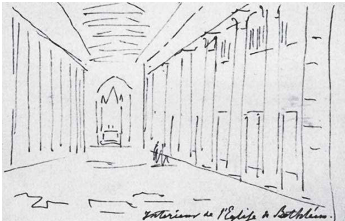
Рис. 1 Церковь Рождества в Вифлееме. ГТГ инв. 4129, л. 1 об. Перспективный набросок.

Основанный Патриархом Никоном в XVII в. возле Истры Ново-Иерусалимский монастырь строился как подобие Святой Земли. На карте Подмосковья появились библейские топонимы: Иордан, Сион, Фавор, Елеон, Гефсимань, Вифания, Вифлеем, Капернаум, Рама. Многие здания в монастыре не только напоминали о святых местах названием, но и в плане повторяли свои прототипы. Так создавался и главный собор монастыря – Воскресенский, построенный по точному плану храма Гроба Господня в Иерусалиме 25 . Для проведения реконструкции Воскресенского собора было необходимо свериться с его оригиналом. Это прекрасно понимал и князь Александр Николаевич Голицын – обер-прокурор Святейшего Синода, куда передали пожелание великого князя Николая Павловича. Нужны были современные чертежи храма Гроба Господня в Иерусалиме. С просьбой о содействии Голицын обратился в Императорскую академию художеств 26 .