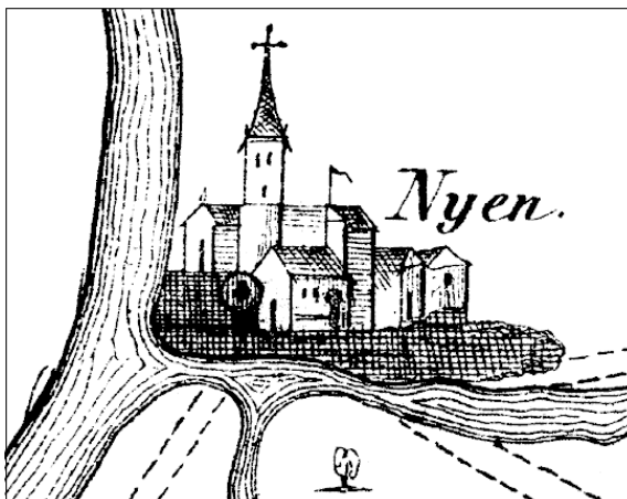
Ниен на карте начала XVII века

В 1642 г. Ниэн получил городской герб – лев, стоящий между двумя реками и держащий в правой лапе меч.