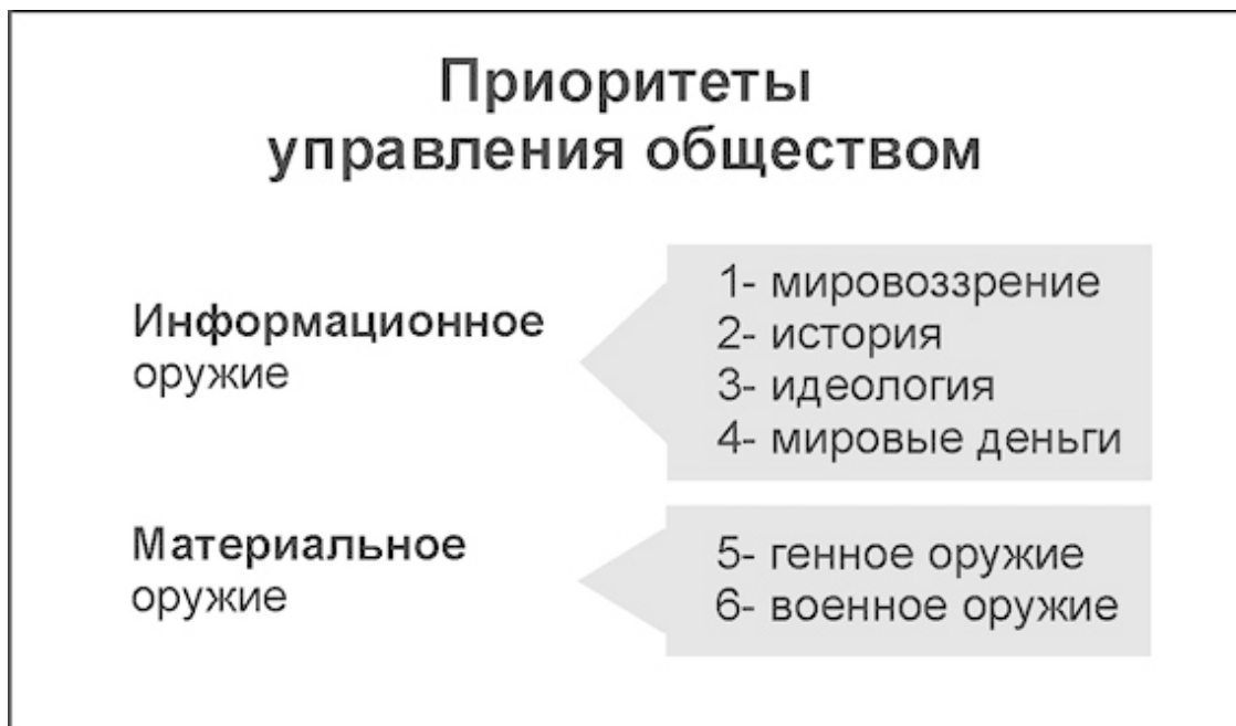
Рис. 3. Приоритеты управления обществом

Сам факт участвовавшего применения этого приоритета свидетельствует о концептуальной беспомощности Запада и о проблемах с более тонким ведением агрессии методами «культурного сотрудничества». России не понадобится использовать в XXI веке войска, если она овладеет концепцией и мировоззренческим оружием, а равно защитой на мировоззренческом уровне, на уровне высших приоритетов.