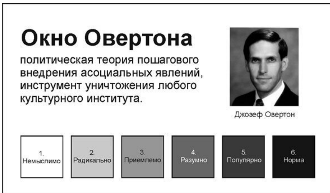
Рис. 2. Этапы перехода общественного сознания от немыслимого к нормальному

То, что поощряется и поддерживается в одной концепции, может расцениваться как тягчайшее преступление в другой. Цели развития человека и общества, а также понятие прогресса формируются не на уровне науки и интеллекта, а на уровне нравственности в опоре на Различение. Возможности по-разному формировать общественное сознание отражает политическая теория «Окно Овертона», которая утверждает, что любое неприемлемое для социального благополучия поведение людей можно сделать «нормой жизни». Для этого необходима длительная цель определенной группы людей, располагающих финансовыми и политическими ресурсами, способная влиять на систему образования, СМИ и законодательство. Ниже представлены этапы перехода общественного сознания от «немыслимого» к «нормальному».