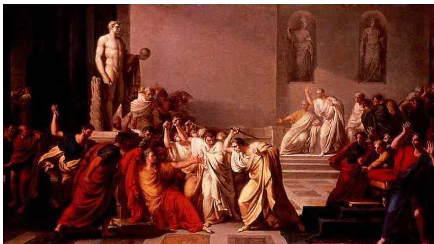
Рис. 2. Виченцо Камуччини «Убийство Цезаря», 1798

19 августа 43 г. до н. э. Рим: консулом избран волновой герой Октавиан Август