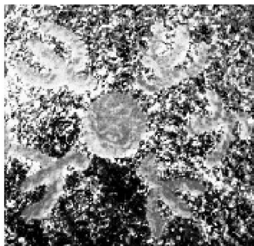
Рис. 1. фотографии наскальных рисунков.

Фотографии наскальных рисунков с темой полного солнечного затмения 18 июля 1229 г. до н. э. с сайта [битая ссылка] http://xjubier.free.fr