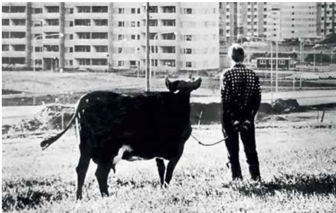
Скучно в городе без коровы.

Исследованы явные и тайные пружины этого процесса. Чтобы он шел непрерывно, через молочную железу коровы каждую минуту должно проходить три с половиной литра крови (в сутки – пять тонн!). Специальные клетки железы «отжимают» из крови все молочные компоненты и по протокам подают готовый продукт в «цистерну» – у коровы она называется выменем. А тут уже либо теленок губами, либо доярка руками, либо машина с вакуумными пульсирующими трубками отсасывает молоко. Избыток его в «цистерне» доставляет коровам страдание. Рассказывают, что во время войны в селеньях, брошенных людьми, коровы бегали за солдатами – подоите!