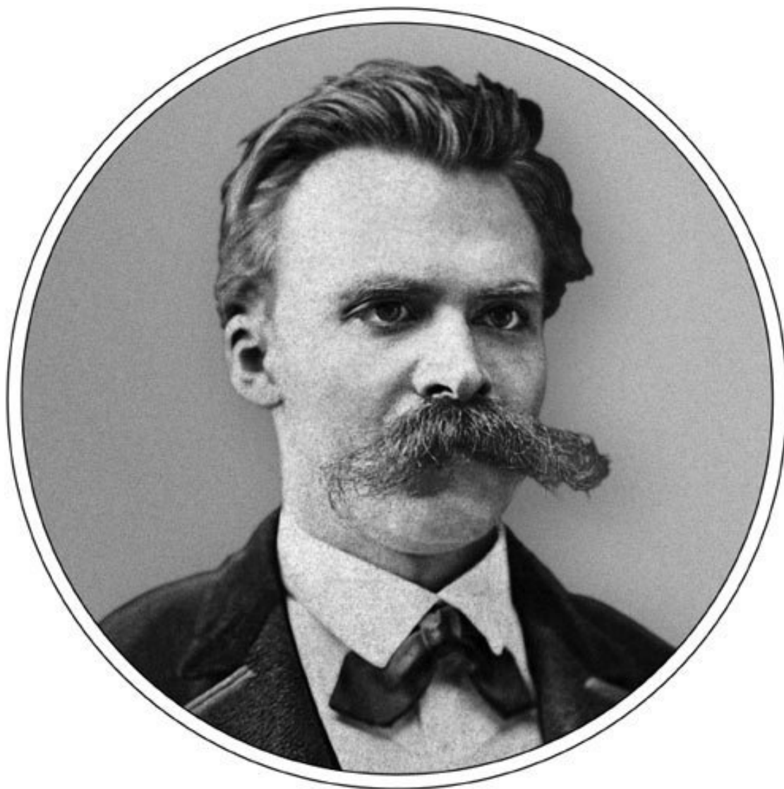
Фридрих Вильгельм Ницше (1844—1990)