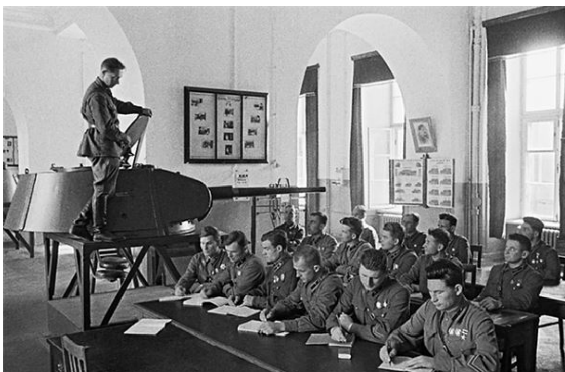
Занятия в Военной Академии им. Сталина. Москва, июнь 1941 года.