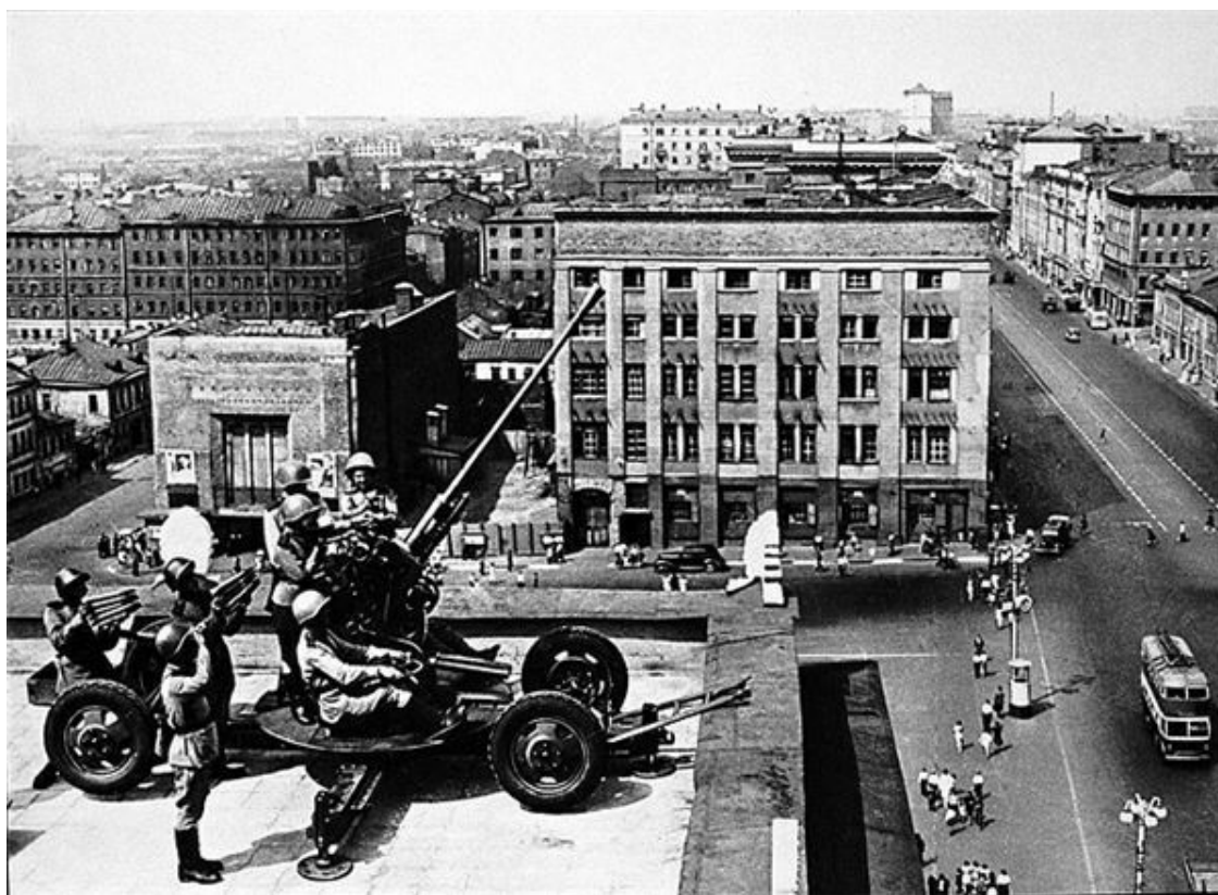
Зенитчики обороняют небо столицы.

Битва за Москву (Московская битва, Битва под Москвой; 30 сентября 1941-го – 20 апреля 1942 года) делится на 2 периода: оборонительный (30 сентября – 4 декабря 1941-го) и наступательный, который состоит из 2 этапов: контрнаступления (5–6 декабря 1941-го – 7–8 января 1942-го) и общего наступления советских войск (7–10 января – 20 апреля 1942-го). В ходе Московской оборонительной операции были проведены Орловско-Брянская, Вяземская, Можайско-Малоярославская, Калининская, Тульская, Клинско-Солнечногорская и Наро-Фоминская фронтовые оборонительные операции.