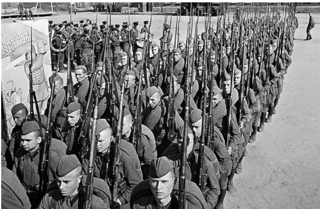
Мобилизация. Колонны бойцов движутся на фронт. Москва, 23 июня 1941 года.

Началась Калининская оборонительная операция советских войск правого крыла Западного фронта, проведённая 10 октября – 4 декабря (после окончания оборонительной операции началась Калининская наступательная операция). Войска правого крыла Западного фронта отступили на рубеж озеро Пено (восточнее Нелидово) – Сычевка. 3-я танковая группа и 9-я армия немецкой группы армий «Центр» перешли в наступление на Ржев и Калинин. 16-я, 5-я, 43, 49-я и 33-я армии Западного фронта завязали бои с основными силами группы армий «Центр» под Калугой и Малоярославцем.