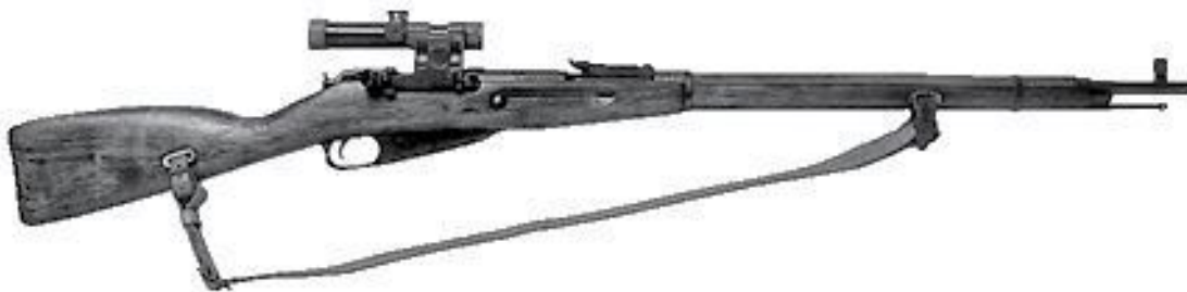
Снайперская винтовка Мосина-Нагана калибром 7,62 мм.

На совещание ГКО, где было принято это постановление, пригласили и председателя Моссовета Василия Пронина. После войны Пронин расскажет, что перед входом в кабинет Сталина он услышал слова Берии, сказанные Молотову и Маленкову: «Москва – не Советский Союз. Оборонять Москву – дело бесполезное. Ну, с чем мы будем защищать Москву? У нас же ничего нет. Остаться в Москве – опасно, нас перестреляют, как куропаток». Берия настаивал на сдаче Москвы немцам и занятии обороны на Волге. Маленков поддакивал ему. Молотов бурчал возражения, остальные молчали. Открывая заседание, вспомнит Пронин, Сталин сказал: «Положение на фронте всем известное. Будем защищать Москву?» Все молчали. Тогда Сталин начал спрашивать персонально. Все, в том числе и Берия, сказали: «Будем защищать».