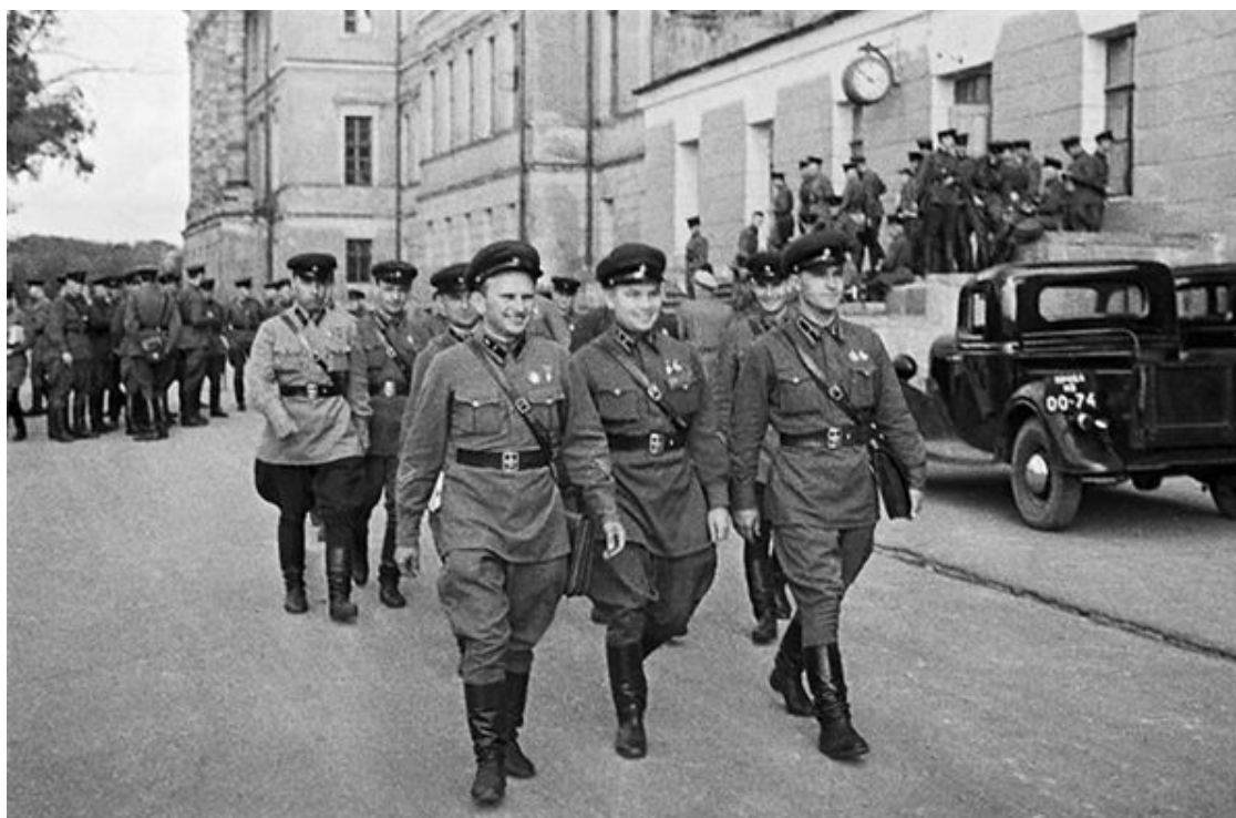
Выпускники Военной Академии им. Сталина. Москва, июнь 1941 года.