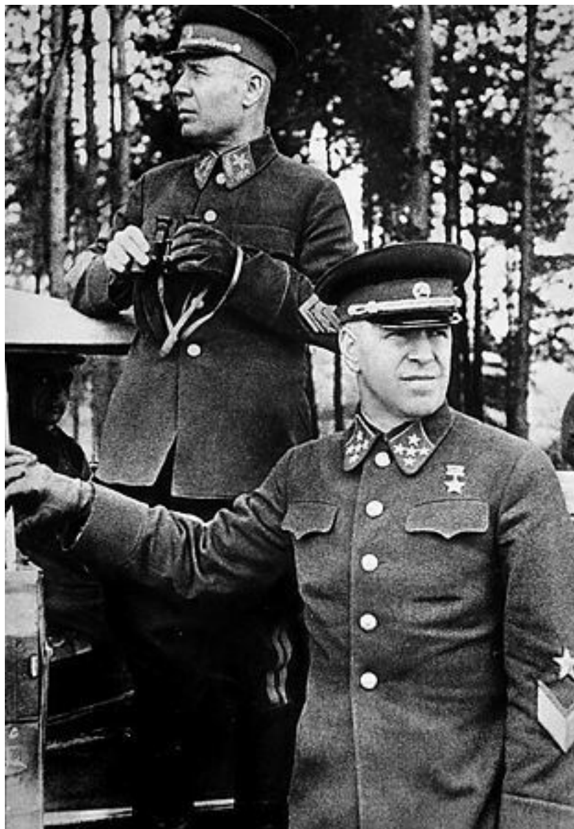
Маршал Советского Союза Семен Тимошенко (слева) и генерал Георгий Жуков (справа) на учениях войск Киевского особого военного округа. 1940 г.