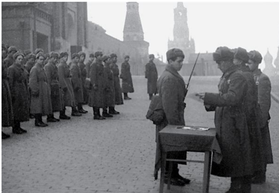
Бойцы принимают присягу на Красной площади. Июль 1941 г.

На вооружении Красной Армии имелось уже 406 установок залпового огня БМ-8 и БМ-13 («Катюши»). 1 июля их было всего 7.