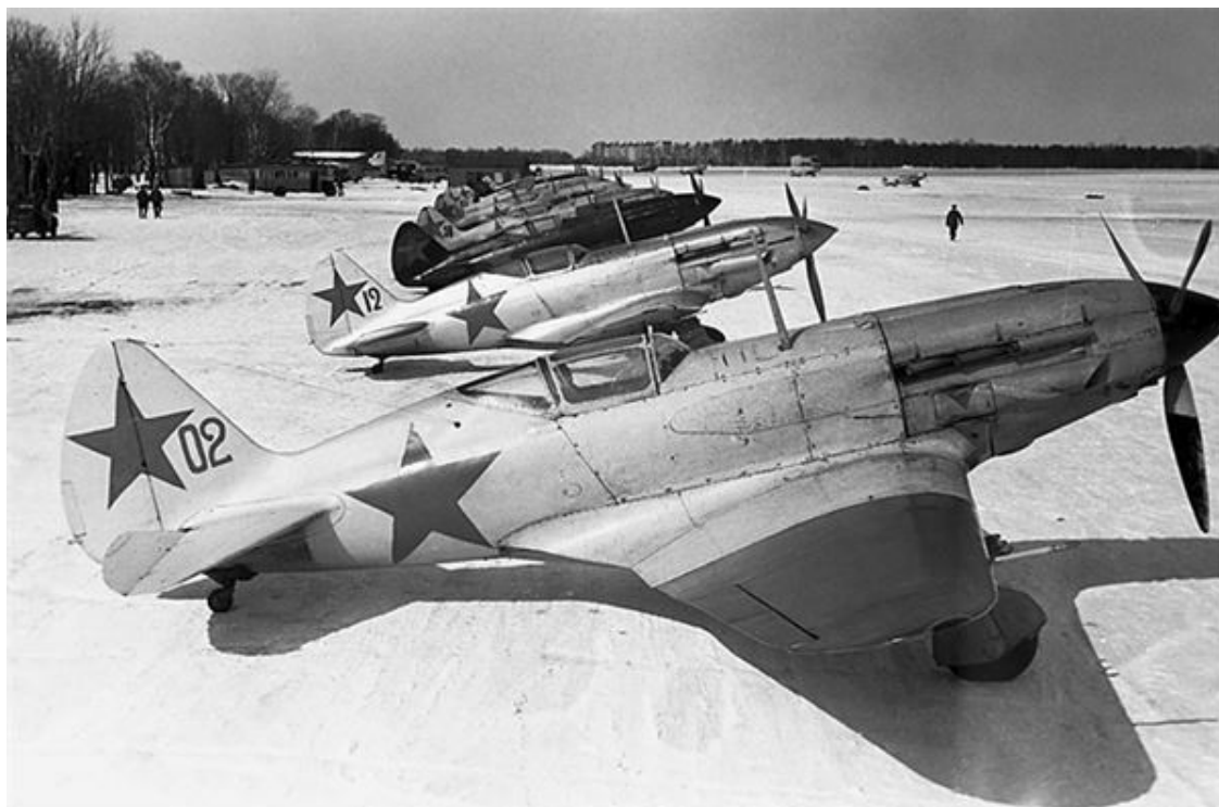
Истребители на подмосковном аэродроме. Зима 1941 г.

ВЛКСМ отправился в райисполком, где секретарша сказала ему, что председатель райисполкома (фамилия не названа. – Ред.) хочет попроситься у секретаря райкома партии выехать из Москвы, но не решается с ним заговорить. Вечером на райком ВЛКСМ обрушилась лавина звонков комсомольцев с заводов и предприятий: все говорили, что рабочим велено покинуть заводы. Комсомольские работники, не имея никакой информации, всем отвечали, что это – провокация, продолжайте работать. Уже поздно вечером секретарь райкома ВЛКСМ вновь побежал за советом в райком партии: «Взволнованно рассказывает о сообщениях. «Не кипятись! Так надо», – успокаивает секретарь райкома партии. «Как «так надо»? Почему?» – «Решение МК... Ясно?» – «Ничего не ясно. Что это делается?»»