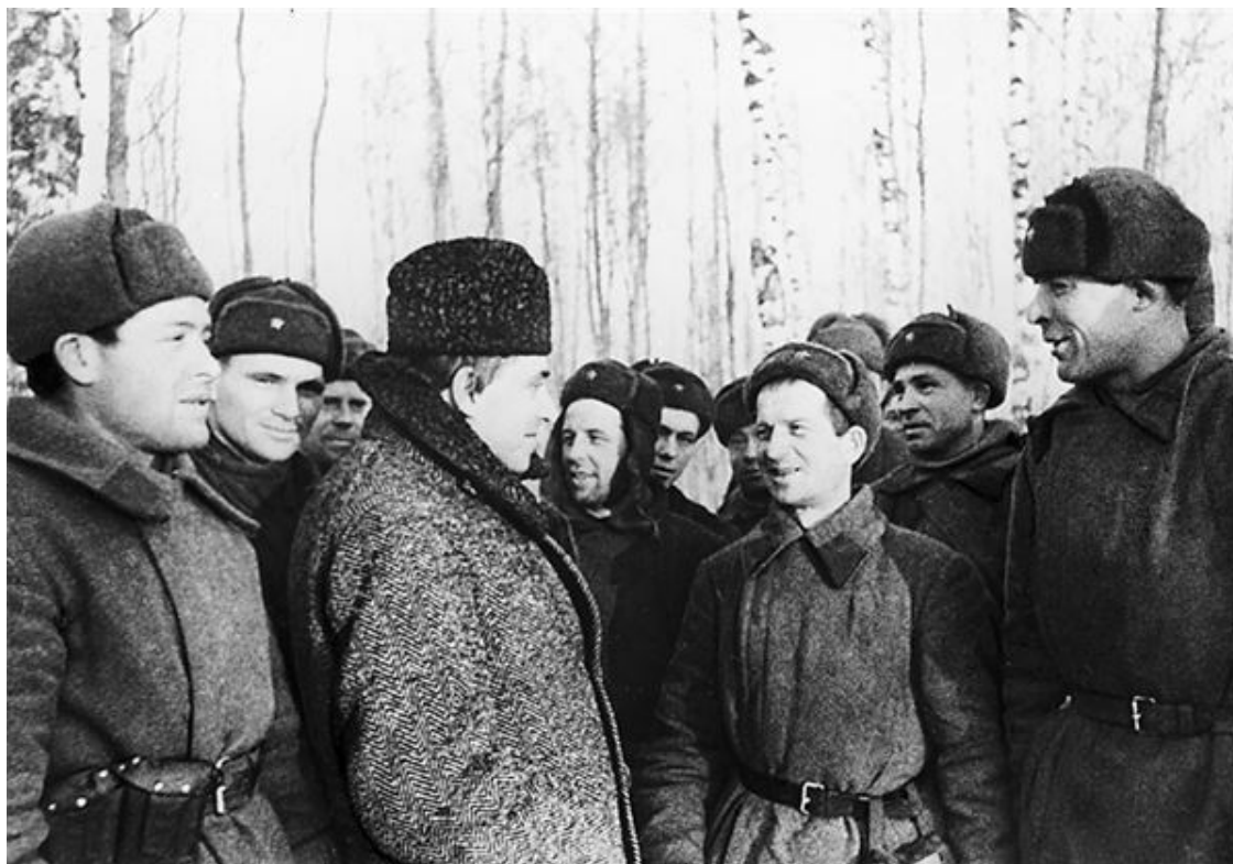
Писатель Илья Эренбург среди солдат.

Только 17 октября по радио выступил первый секретарь Московского горкома ВКП(б) Александр Щербаков, более или менее убедительно разъяснил необходимость эвакуации некоторых учреждений и промышленных предприятий, решительно опроверг слухи о готовящейся сдаче столицы, призвал москвичей защищать столицу до «последней капли крови» и сказал самое главное, что Сталин – в Москве. Никакого геройства в том, что Сталин остался в столице, усматривать не стоит: на Центральном аэродроме Иосифа Виссарионовича постоянно ждали 4 самолета, на железнодорожной платформе вблизи завода «Серп и молот» стоял бронепоезд. В Куйбышеве для Сталина было подготовлено жилье в здании обкома партии. На берегу Волги отремонтировали несколько дач, под землей соорудили колоссальное бомбоубежище. Многие историки утверждают, что Сталин в один из этих дней даже прибыл на платформу, дошел до бронепоезда, но развернулся и вернулся в Кремль.