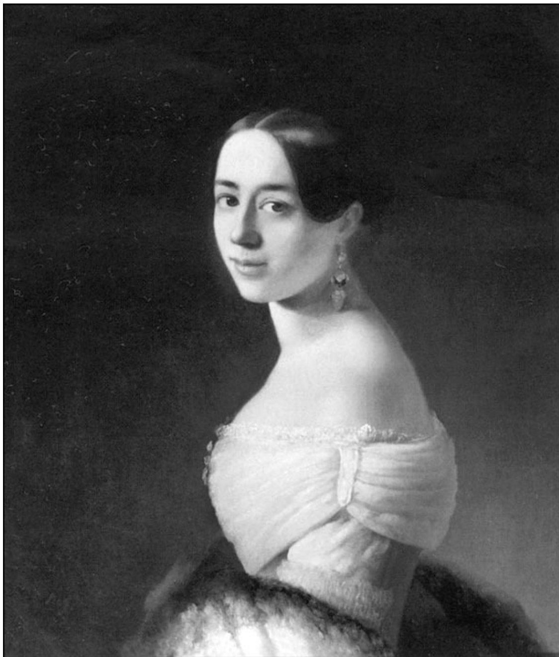
Полина Мишель Фердинанд Гарсиа-Виардо. Художник Тимофей Нефф. 1842 г.

Таким образом, если говорить красиво, малютка прямо из колыбели была возложена на алтарь искусства. Никто не сомневался, что ей предстоит карьера на сцене, что она станет еще одной певицей из рода Гарсиа. Но это был тот редкий случай, когда семейный сценарий совпадал с личными склонностями и устремлениями. Полина не мыслила себя без музыки. «Я не помню времени, когда бы ее не знала», – говорила она, уже будучи взрослой. Трех лет от роду девочка уже выучилась читать ноты.