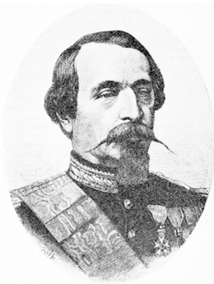
Луи-Наполеон Бонапарт (Наполеон III).

К восьми часам вечера, исполненный чувства глубочайшего удовлетворения от первого дня на борту, он замечает на горизонте свет далекого маяка. Последний знак, посылаемый землею Франции.