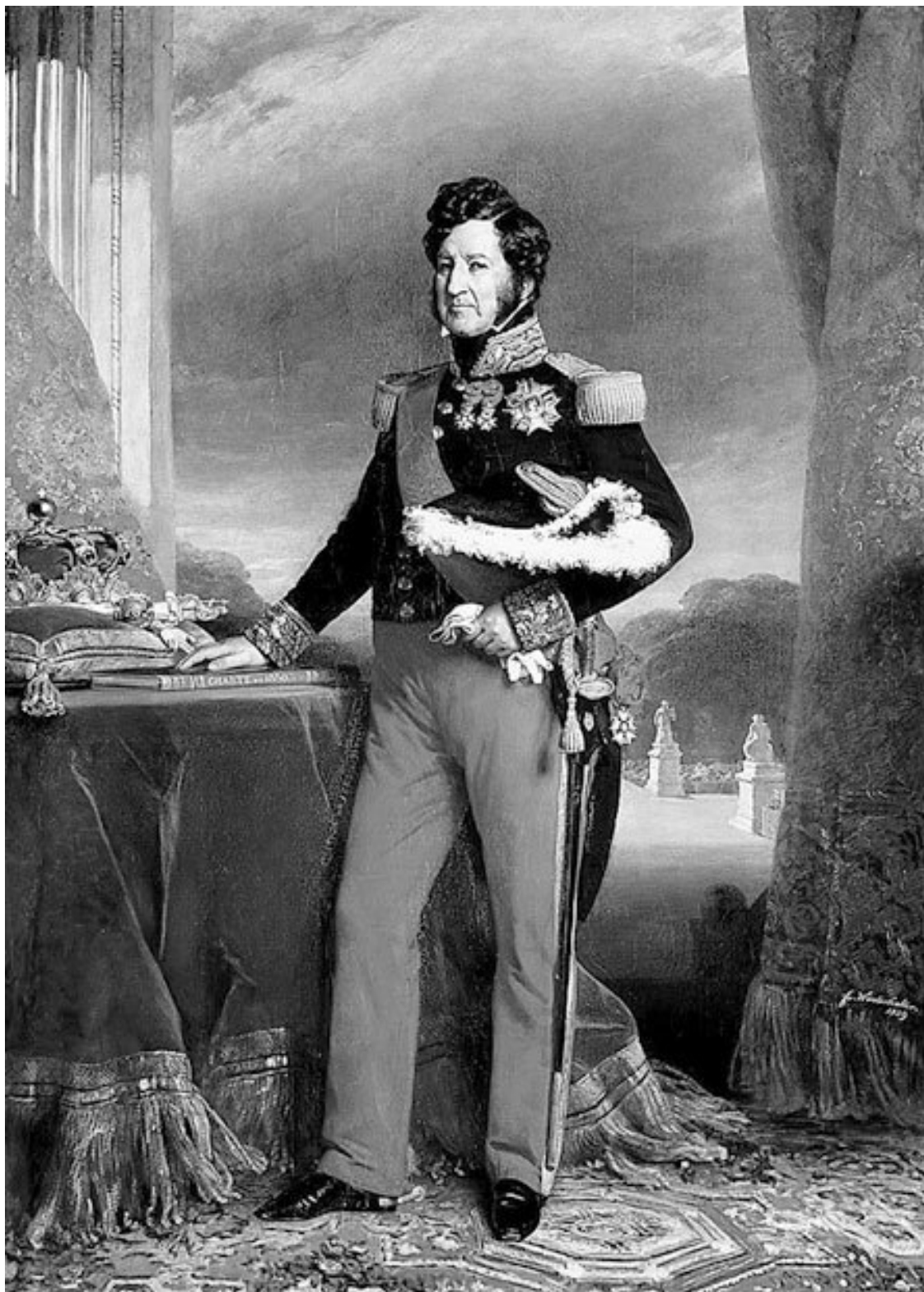
Франц Ксавье Винтерхальтер. Портрет Луи-Филиппа.

Отметки подростка вряд ли могли смягчить отношение г-на Мане к офицеру, возмнившему себя рисовальщиком. Риторика – «посредственно»; математика – «удовлетворительно»; история – «весьма поверхностно»... Что касается оценки «очень хорошо», полученной за рисунки, то для отца это хуже всякого порицания. Ученик Мане упорствует в своих так хорошо известных ошибках. «Прилежание и поведение: нам не удалось констатировать здесь никаких сдвигов». Имеет ли смысл при таком положении подавать на конкурс в Мореходную школу? В