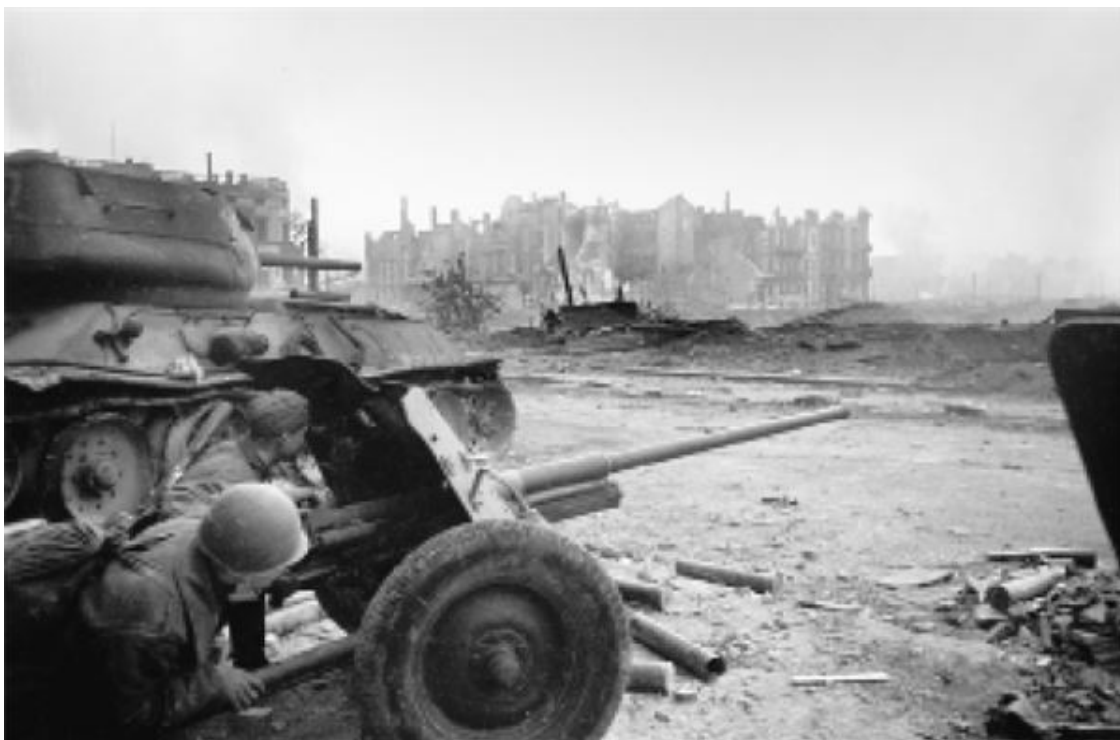
Бой на подступах к Рейхстагу. Берлин

В этот день на всех фронтах подбито и уничтожено 50 немецких танков и самоходных орудий. В воздушных боях и огнем зенитной артиллерии сбито 40 самолетов противника.