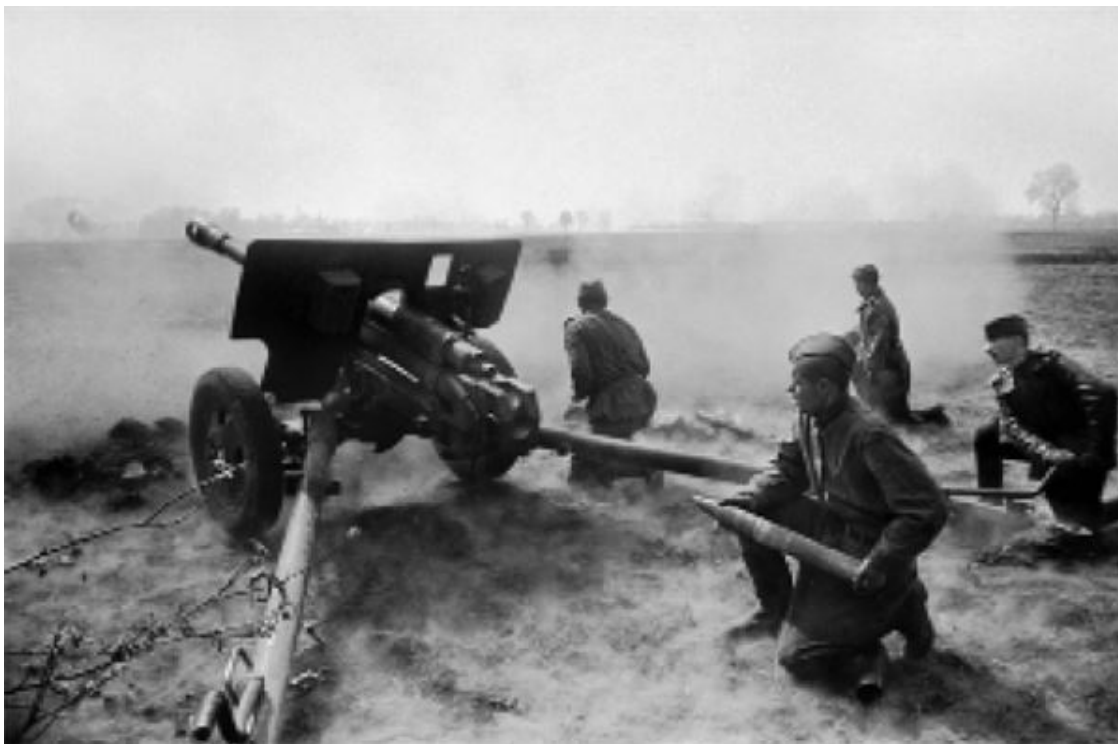
Орудийный расчет ведет бой на окраине города. 1-й Белорусский фронт

В этот день на всех фронтах подбито и уничтожено 50 немецких танков и самоходных орудий. В воздушных боях и огнем зенитной артиллерии сбито 42 самолета противника.