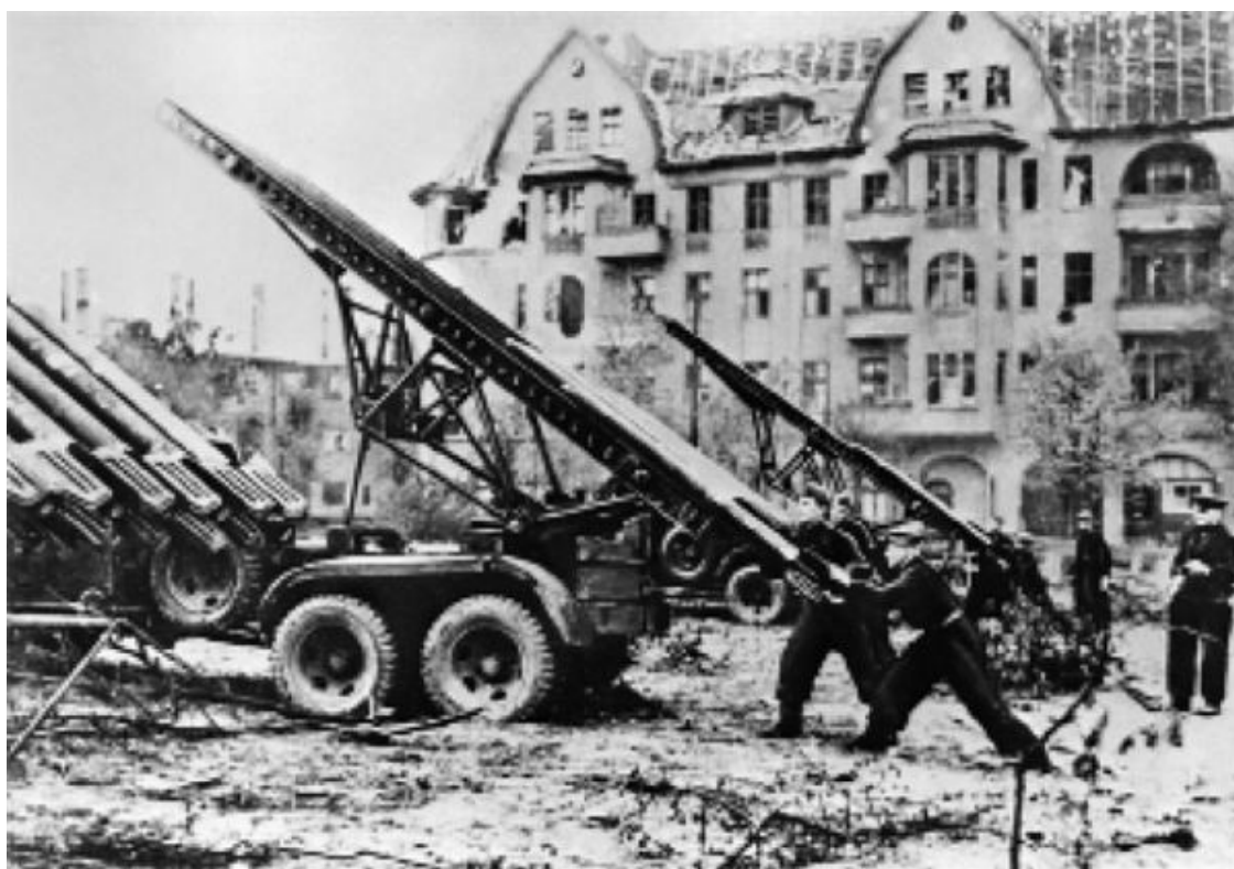
Советские артиллеристы во время боев на улицах Берлина

Наша авиация наносила бомбардировочно-штурмовые удары по скоплениям войск и техники противника. В Данцигской бухте потоплены два немецких транспорта.