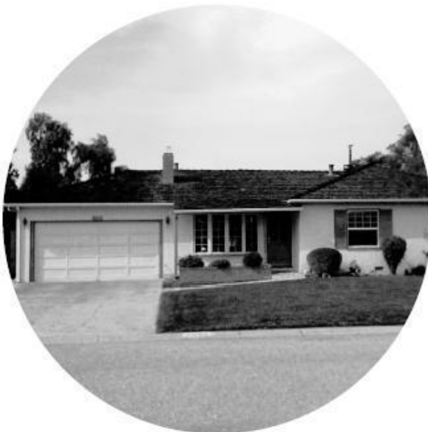
Дом в Саннивейле и гараж, где начиналась компания Apple