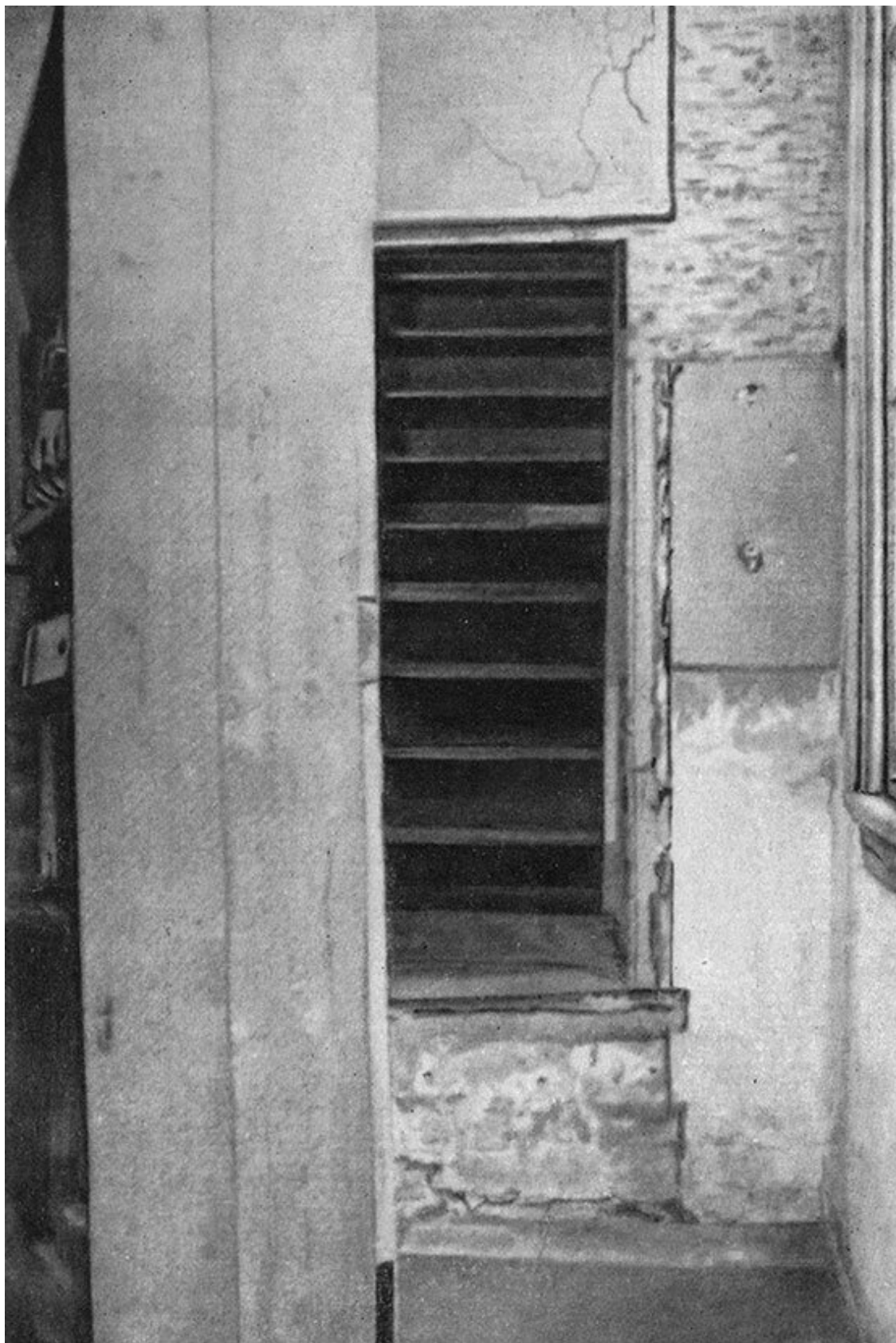
Повернутая полка, открывавшая лестницу в убежище