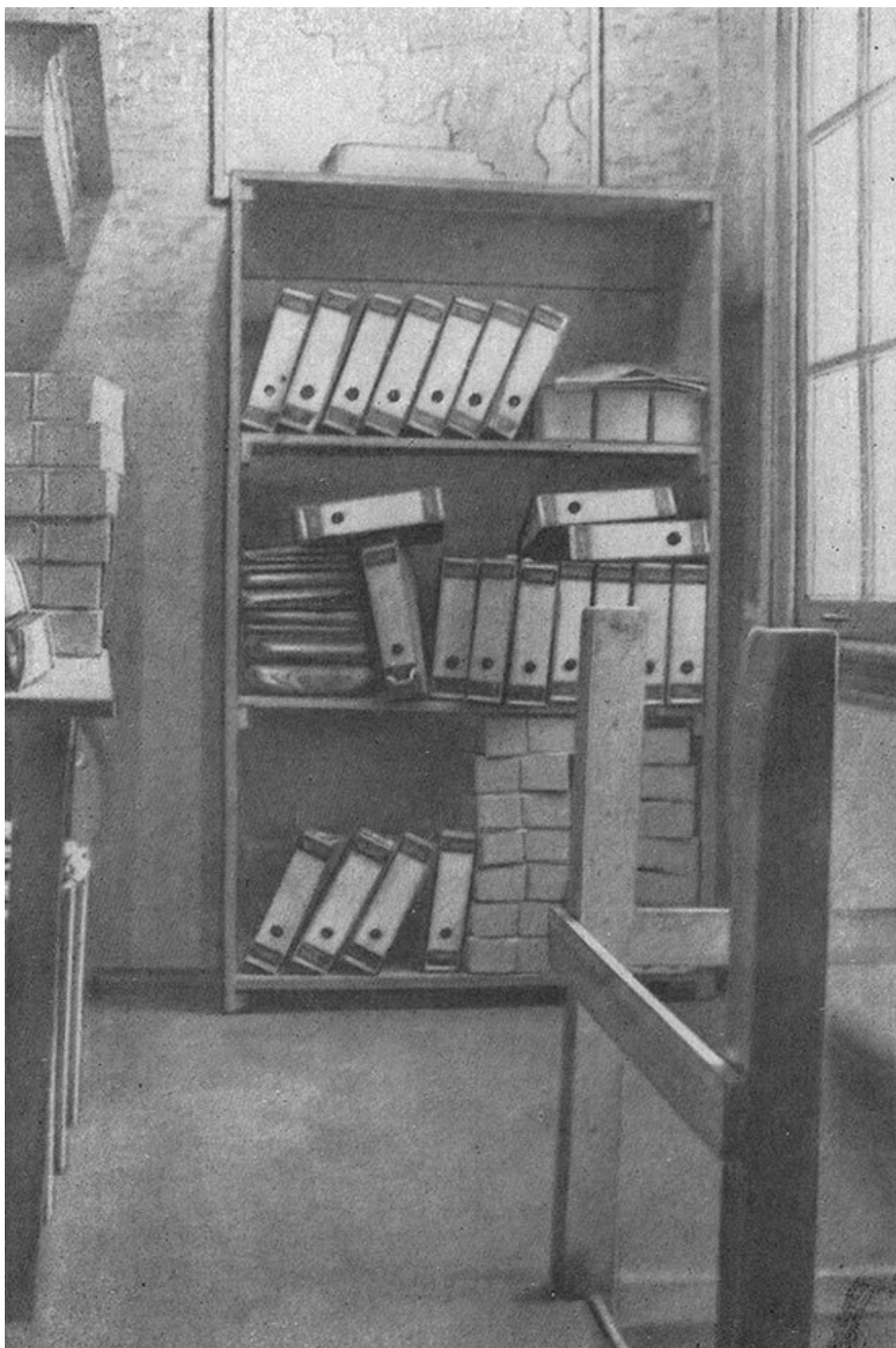
Подвижная книжная полка, маскировавшая вход в заднюю половину дома