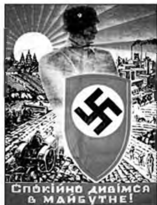
Рис. 15. «Спокойно смотрим в будущее»

«великой Германии». В национал-социалистских плакатах и листовках отчетливо звучал мотив долга перед «избавителями»: «Работая в Германии, ты защищаешь свое отечество! Иди в Германию!», «Украинцы! Включайтесь в европейский фронт обороны против большевизма!» и т.д.