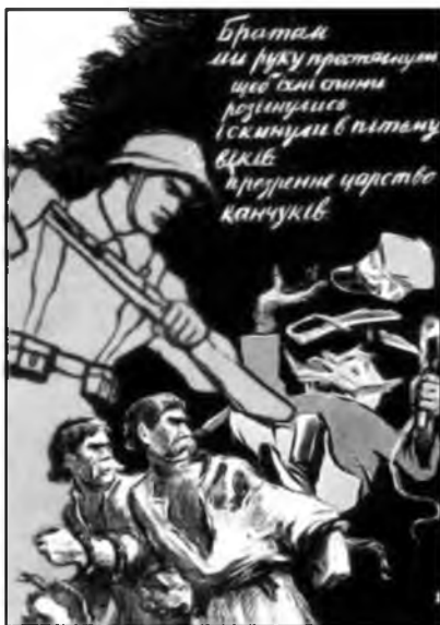
Рис. 3. «Царство канчуков»

из рук. Тем не менее, никакого сочувствия к поверженной армии, защищавшей, кстати, свое государство, у зрителя не может и не должно быть, ведь с выбитой из рук сабли капает свежая кровь, а в рукоять плети (канчука) пальцы офицера вцепились намертво.