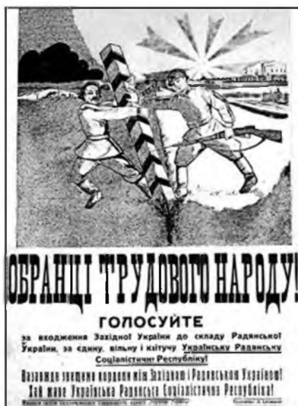
Рис. 5. Л. Сечишин. Предвыборный плакат

— Мы знали, — говорит он, — как радостно живет крестьянство по ту сторону границы, в советской стране.