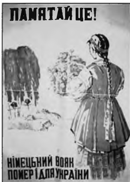
Рис. 14. Помните! Немецкий солдат погиб за Украину»

«великой Германии». В национал-социалистских плакатах и листовках отчетливо звучал мотив долга перед «избавителями»: «Работая в Германии, ты защищаешь свое отечество! Иди в Германию!», «Украинцы! Включайтесь в европейский фронт обороны против большевизма!» и т.д.